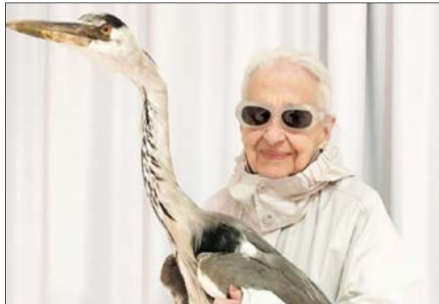
عارضة الأزياء إرنست ستولبيرغ

من 10 آلاف، يرون أنها ذات لمسات راقية في الخيارات الأنيقة، وأن عليها أن تفكر في ارتداء هذه الملابس في رحلة خارجية.