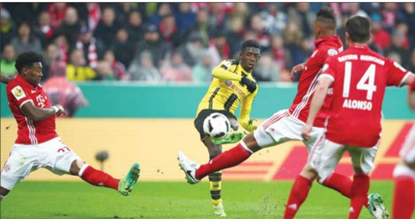
الفرنسي عثمان ديمبيلي سجل هدف التاهل لدورتموند

بكر بوروسيا دورتموند حلم غريمه بايرن ميونخ بطل الموسم الماضي في إحراز اللقب المحلي مجدداً وبلغ المباراة النهائية بفوزه عليه 3-2 في ميونخ أول من امس في الدور نصف نهائي مسابقة كأس ألمانيا لكرة القدم. وسجل ماركو رويس (19) والغابوني بيار ايميريك اويامانغ (69) والفرنسي عثمان ديمبيلي (74) أهداف بوروسيا دورتموند، والإسباني خافيير مارتينيز (29) وماتس هوملز (42) هدفي بايرن ميونخ.