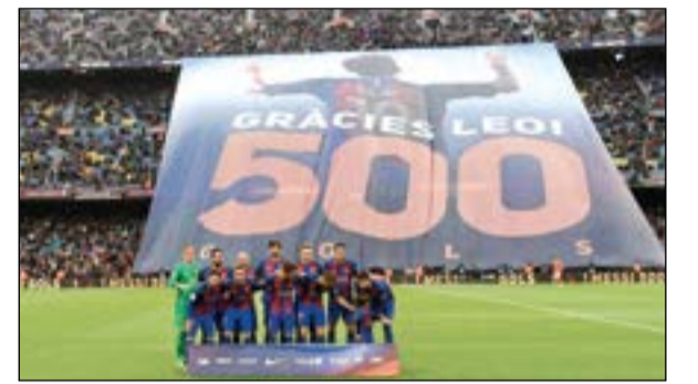
احتفال كبير من جماهير البرسا بنجمها ليونيل ميسي

احتفت جماهير برشلونة بنجم فريقها الأول الأرجنتيني ليونيل ميسي، الذي احتفل في المباراة السابقة أمام ريال مدريد بتسجيله الهدف رقم 500 في مسيرته الاحترافية.