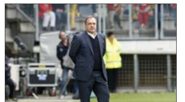
الهولندي ديك ادفوكات

ذكرت صحيفة «دي تيليغراف» الهولندية في عددها الصادر اليوم، أنه سيتم تعيين ديك ادفوكات مديرا فنيا للمنتخب الهولندي لكرة القدم، والنجم الدولي السابق رود غوليت مساعدا له.