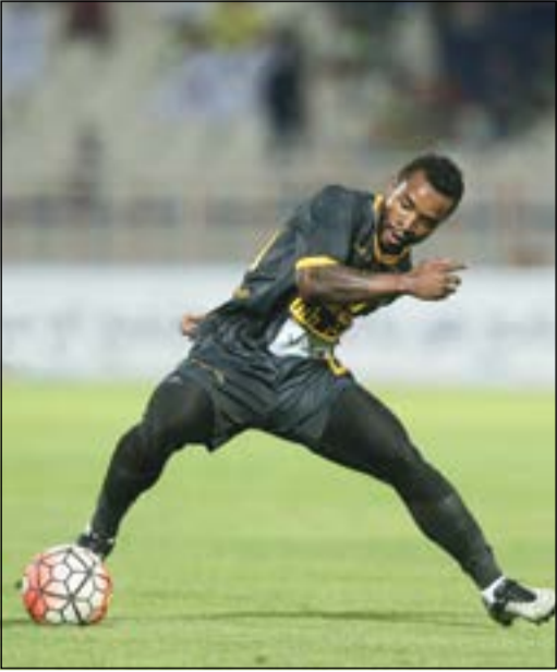
سيدوبا قدم مستويات طيبة مع القادسية الموسم الماضي (الازرق.كوم)