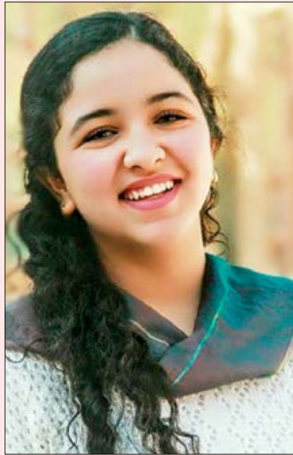
سفيرة الطرب المصري، هانيا سليم

الكلمات التي تناسب صوتي. وتمت المطربة هانيا سليم الغناء في مهرجان «هلا فبراير» وقالت أنه من المهرجانات المهمة في الوطن العربي لمشاركة كبار المطربين فيه مثل الرحلة وردة المطربة القديرة ماجدة الرومي.