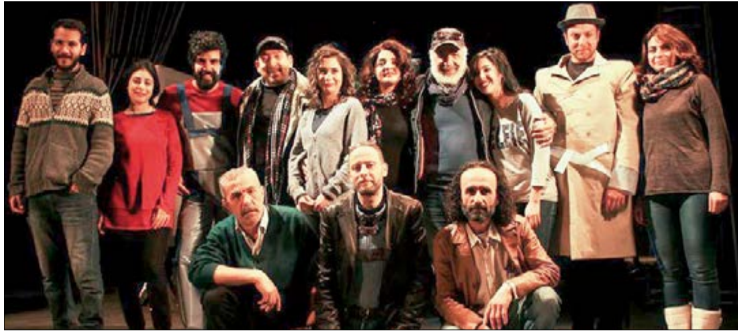
فريق «اختطاف» في لقطة جماعية

وهي مقتبسة عن مسرحية «الأبواق والتوت البري» عام 1981 للمسرحي الإيطالي الراحل داريو فو الحائز جائزة نوبل عام 1997. وعن مضمون المسرحية قال جعفروري: عندما ننظر للمصاعف العالمية بين الدول الكبرى نجد صراعات اقتصادية، وإن الأنظمة العالمية لا تتحرك بالحروب إلا من أجل الاقتصاد، ومن هنا وجدناها ملامسة لقوانين أساسية، وأنها هي المحرك الأساسي للأنظمة في العالم، وهذا ما يجري على الأرض السورية تحت مسميات الربيع العربي وغيره، لكننا اعتمدنا أن ندخل الكوميديا لنجعل الناس تعيش حالة من الراحة النفسية، وتنسى يوميات الهاون والقصف وغيره، أي تمرير المسرحية بنسخة ورؤية سورية جميلة تحاكي الواقع. وفسر جعفروري قوله بأن المسرحية اعتمدت بنسخة سورية، قائلاً: بكل تأكيد الذي يختطفها بيت سوري عانى ولا يزال يعاني من وقع الحرب على بلاده، ولا يوجد منزل إلا