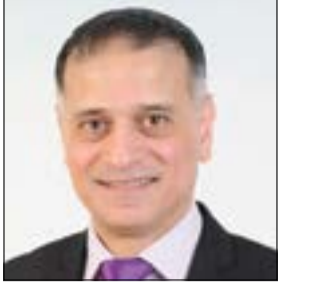
إعداد: د. طارق البكري