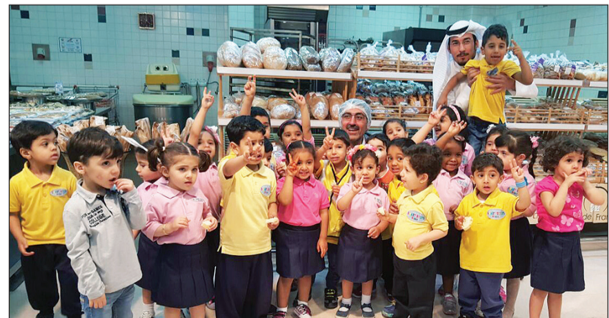
براعم Smart Steps في «سلطان السالمية»

هي العمل على تثقيف جيل الشباب حول تجارة التجزئة التي من شأنها إعدادهم لحياة مهنية رائعة في المستقبل». وفي نهاية الزيارة، كافأ مركز سلطان أطفال الحضانة بأكياس مليئة بالوجبات الخفيفة الصحية. ويحرص مركز سلطان منذ نشأته على نشر التوعية في المجتمع عبر رعايته للعديد من الفعاليات الاجتماعية أو من خلال إطلاق المبادرات والحملات التعليمية والترويجية.