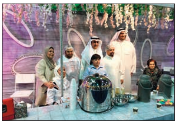
اللواء م.علي الديحاني يتوسط المشاركين في المعرض