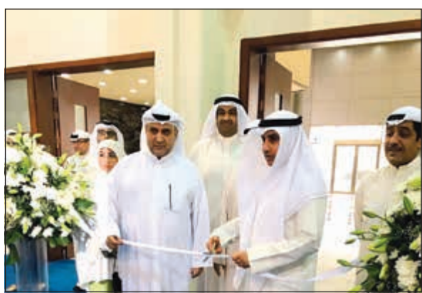
اللواء م.علي الديحاني أثناء افتتاح المعرض