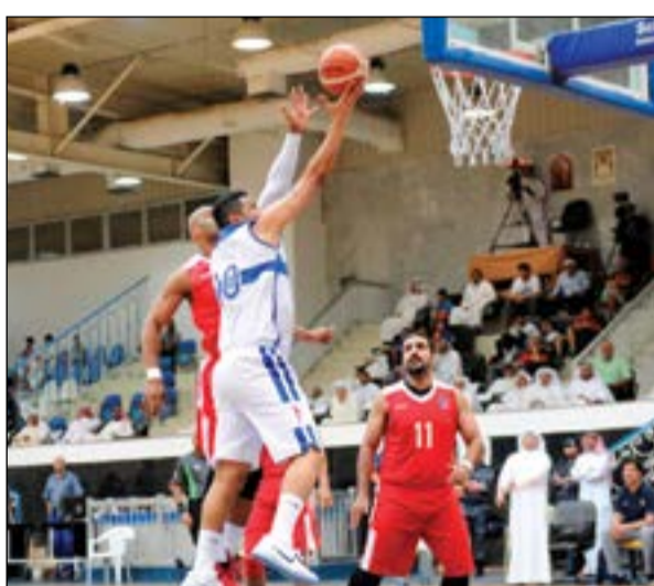
الكويت والجهراء يجتازان عن لقب كأس السلة