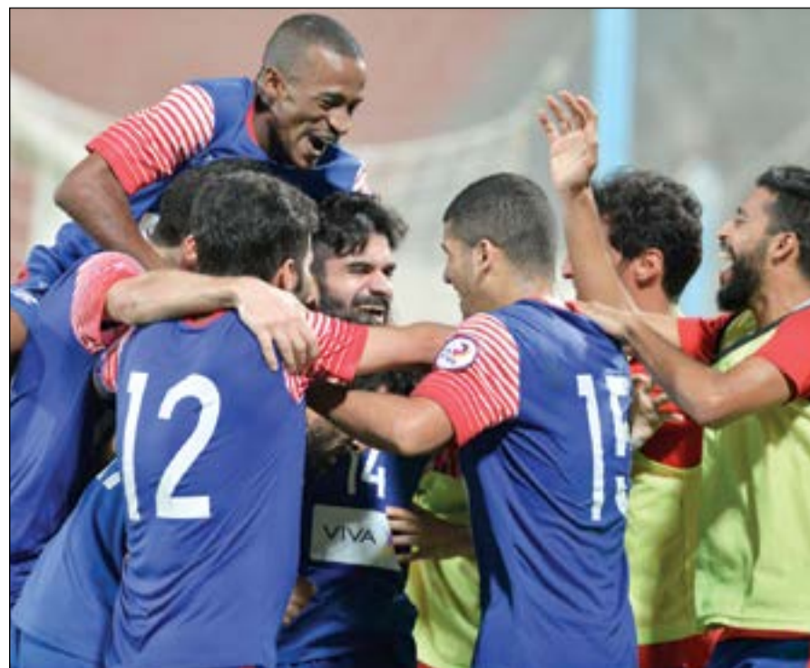
التضامن يسعي لتأمين مركزه من بوابة الساحل