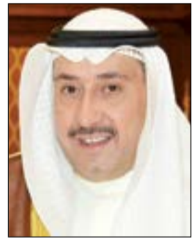
الشيخ فيصل الحمود

تحت رعاية محافظ الفروانية الشيخ فيصل الحمود يفتتح صباح اليوم الثلاثاء معرض «شباب إكسبو»، والذي تقيمه وتنظمه شركة معرض الكويت الدولي من 25 إلى 28 ابريل الجاري على ارض المعارض الدولية بصالة رقم 6 بمشرف. وتستمر أنشطة معرض «شباب إكسبو» 4 أيام بمشاركة عارضين يمثلون مجموعة من الشباب الكويتي من الكوادر الوطنية، حيث تجاوز عدد المشاركين 100 عارض، جاءوا للمشاركة والتنافس في عرض