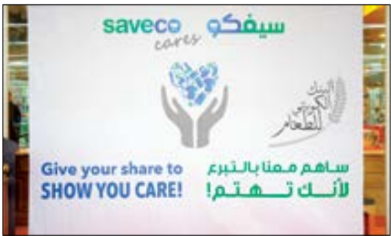
شعار مشروع بنك الكساء