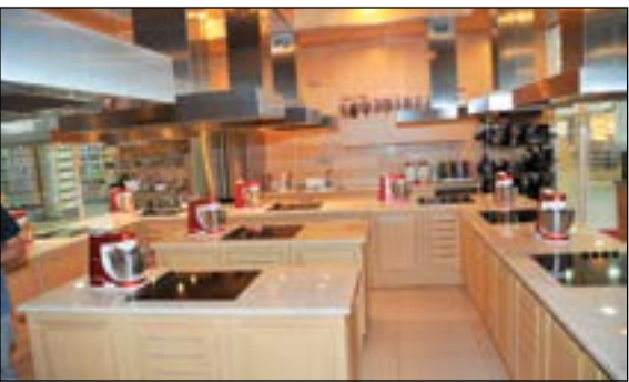
من تجهيزات سيفكو