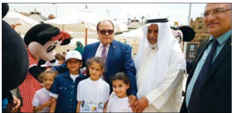
جانب من فعاليات حفل تكريم الأيتام

فهؤلاء يحتاجون رعاية نفسية واجتماعية وتعليمية ليكونوا بدورهم إضافة وقيمة أخلاقية وحضارية للأمة الإسلامية، ولدينا في العديد من الدول قرى كاملة للأيتام، وتابع: تبلغ كفاية البيت الشهرية 15 دينارا ويتم دفعها حسب رغبة الكافل كاستقطاع شهري أو سنوي، ومن خلال هذا المبلغ نوفر للأيتام أهم متطلبات الحياة، ونقوم باستمرار بزيارة الأيتام والوقوف عن كثب على أهم متطلباتهم الحالية، ونكرم المتميزين دراسيا منهم ونحتهم