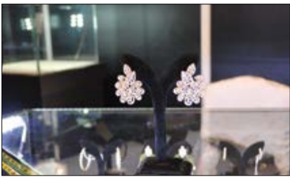
من جناح جويل بالاس للمجوهرات