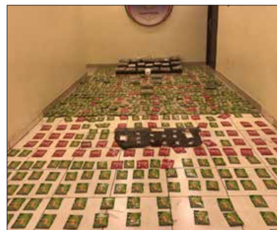
من المخدرات المضبوطة في قبضة «المكافحة»