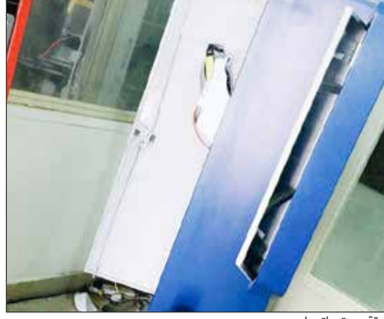
ماكيتا الطوابع بعد سرقة محتوياتها