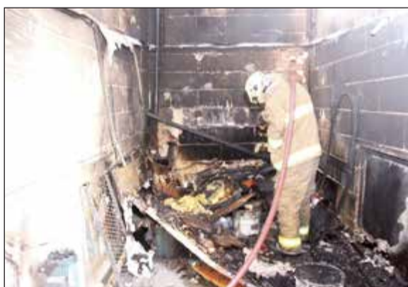
آثار الحريق على مخلفات المخزن

أخمد رجال الإطفاء حريقاً اندلع في عمارة بمنطقة حولي، وكانت عمليات الإدارة العامة للإطفاء قد تلقت بلاغاً بالحادث ففرع رجال اطفاء مركز حولي الى موقع الحريق الذي تبين انه نشب في أغراض مخزن يقع في عمارة بمنطقة حولي، وقام رجال الإطفاء بمكافحة الحريق وإخماده من دون وقوع أي إصابات بشرية، وتم استدعاء مراقبة تحقيق حوادث الحريق للكشف عن الأسباب التي أدت الى وقوعه.