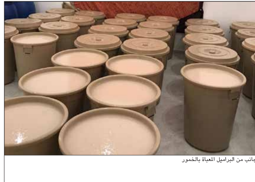
جانب من البراميل المعبأة بالخمور

وأوضح ان النيابة العامة انتهت الى ان الشكوى كيدية ولا توجد شبهة جرمية، إذ إن موكلته سيدة الأعمال قامت بإرسال رسائل واتساب للشاكى لاسترجاع مبالغ مالية منه، وهناك قضايا متبادلة بينهما لاتزال منظورة في المحاكم ولم تقصد تهديده، وأكد السعيد أن موكله التاجر المتهم الثاني لم يقم بتحريض المتهم الأولى وان موكله أنكرها الاتهامات الموجهة اليهما.