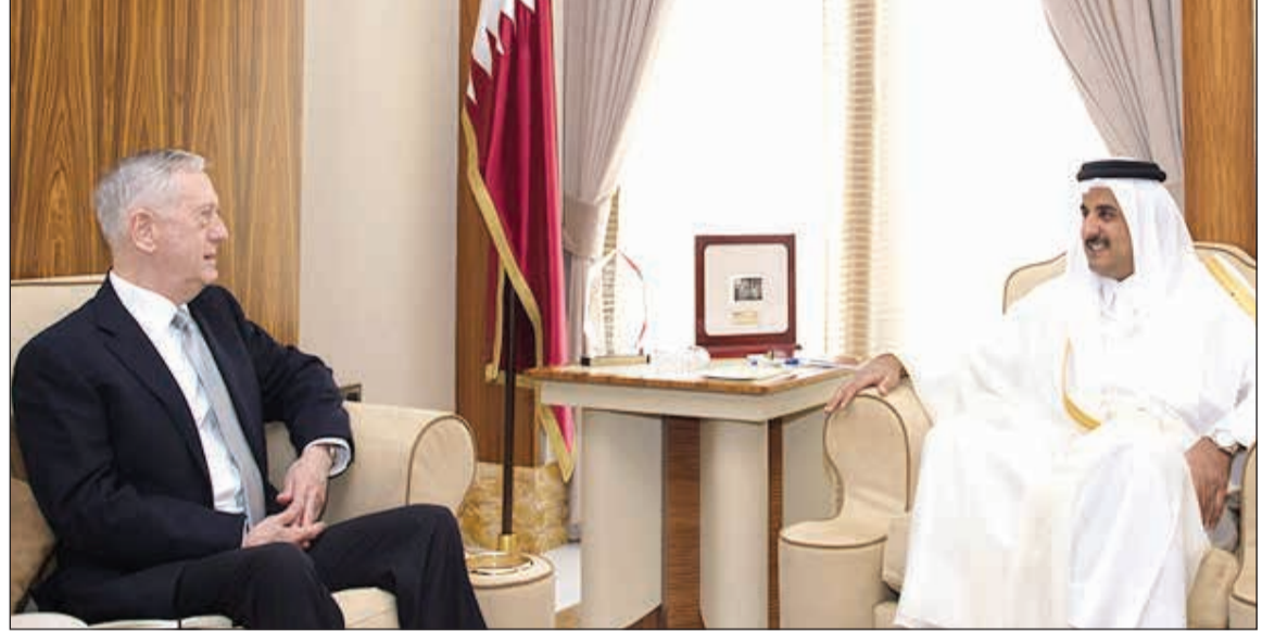
صاحب السمو الشيخ تميم بن حمد آل ثاني أمير قطر خلال استقباله وزير الدفاع الأميركي جيمس ماتيس في الدوحة أمس

وللمملكة العربية السعودية ملكا وحكومة وشعبا بعودة المواطنين القطريين والسعوديين المختطفين إلى وطنهم.