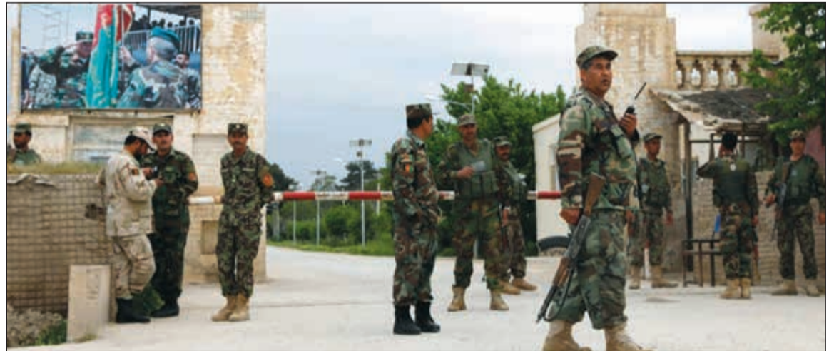
عسكريون أفغان يقفون أمام مدخل القاعدة العسكرية التي استهدفها «طالبان» في مزار شريف

أطلق المهاجمون النيران بكثافة من أسلحتهم على جنود تجمعوا لتناول الطعام في القاعدة أو هم يغادرون المسجد بعد الصلاة، فيما فجر عدد من المهاجمين أحزمة ناسفة.