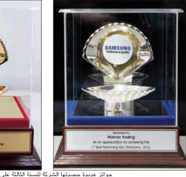
جوائز عديدة حصدها الشركة للسنة الثالثة على التوالي