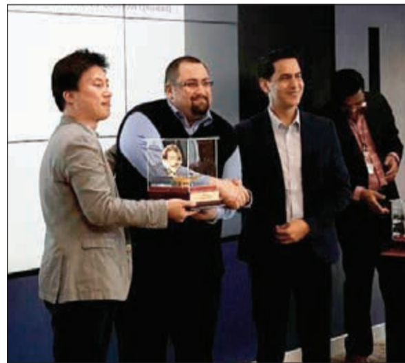
تكريم «وهران التجارية» خلال الاجتماع السنوي لشركة سامسونج