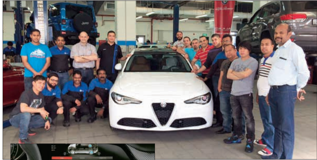
المشاركون في البرنامج

ست أسطوانات، مستوحى من تقنيات وخبرات فيراري، ويشتمل على نظام تعليق مطور حصري لعلامة ألفا روميو وعلى حلول تقنية متطورة أخرى من بينها عزم الدوران Torque Vectoring لتحكم كبير في الثبات، نظام الفرامل المدججة لتقليل مسافة الكبح بصورة كبيرة ونظام الفصل الهوائي النشط Active Aero Splitter لإدارة بالكامل لخفض القوة من منطلق