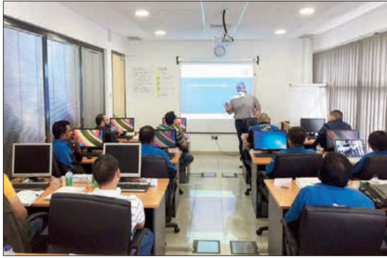
جاناب من البرنامج