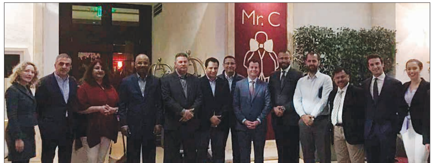
الوفد مع فريق إدارة «مستر سي»