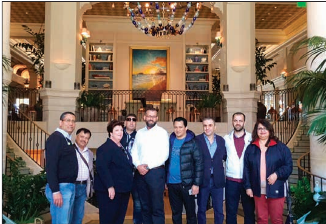
اعضاء الوفد في صورة تذكارية في بهو فندق «كاسا ديل مار» سانتا مونيكا

يعتبر شاطئي «فينيس» من أجمل الشواطئ المحيطة بالفندق. فهو يقع على بعد 15 دقيقة بالسيارة. كذلك يقع مطار لوس انجليس الدولي على بعد 14,5 كم. ومن الخدمات المتميزة التي يوفرها الفندق لنزلائه، انه يضع في غرفهم عدا من الكتب المفيدة جدا فيما يتعلق بخرائط المناطق المحيطة بالفندق، وامكانيات التشرک والتزنده، وممارسة الانشطة المختلفة في هذه المناطق، بالإضافة الى توفير سيارة فارها لنقل النزلاء الى أي مكان يريدونه في محيط 3 أميال منه كخدمة مجانية.