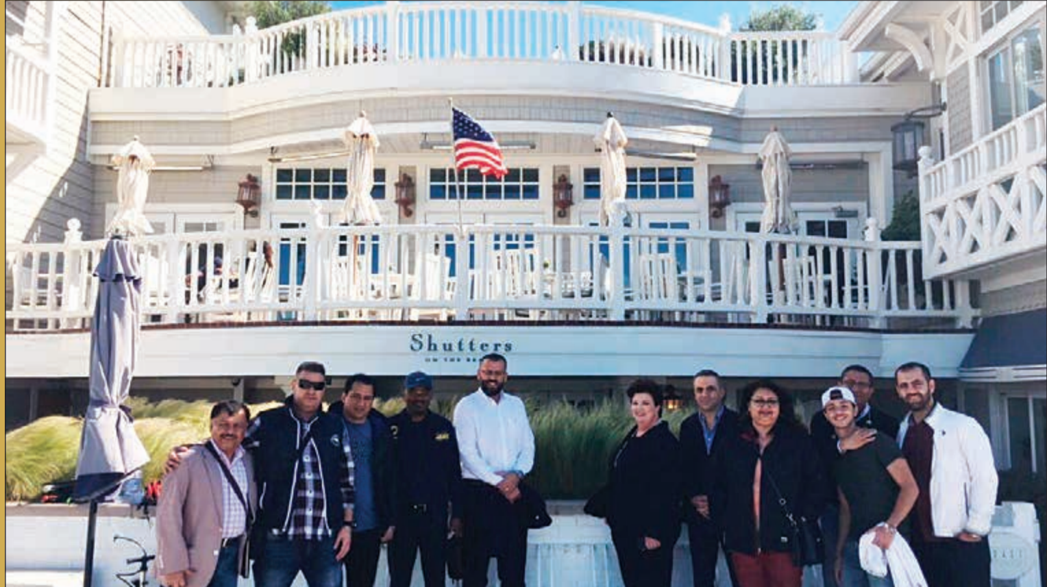
.. وامام فندق شترز أون ذي بيتش

لدى الحديث عن فندق شترز أون ذي بيتش، لا بد من الإشارة الى ان التصميم الداخلي للفندق هي من عمل المصمم ذاته الذي استخدمه الرئيس الأميركي السابق باراك اوباما لاضافة لمساته على ديكورات البيت الابيض والذي جعل منه واحة شاطئية انيقة ومنتجعا فاخرا يلامس البحر، ويقع في الوقت نفسه على مسافة قريبة من اهم معالم التسوق والسياحة في سانتا مونيكا ومن مركزها التجاري.