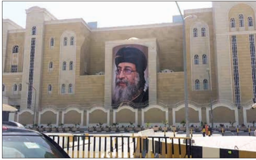
صورة البابا تواضروس تزين كاتدرائية مار مرقس في حوالي