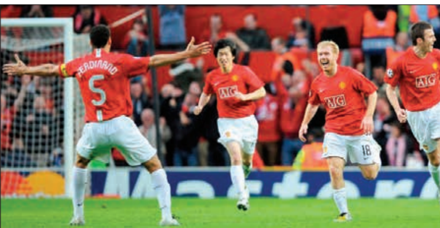
ليوناردو أول من سواها

كما شهد الدور نصف النهائي من المسابقة تأهل الرباعي ريال مدريد، أتلتيكو مدريد، موناكو ويوفنتوس لتحدث واقعة لم تحدث منذ عقد من الزمان بطلاها برشلونة والبايرن. فخلال تلك السنوات العشر كان الفريقان أو أحدهما على الأقل ضيفا دائما على الدور نصف النهائي من البطولة لكن أحدا منهما لم يصل لهذا الدور في النسخة الحالية.