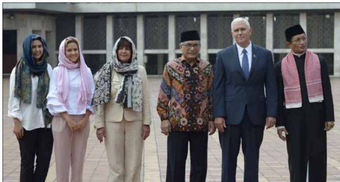
صورة جماعية لنائب الرئيس الأمريكي مايك بنس وزوجته وابنتيه بساحة مسجد الاستقلال بجاكرتا مع اثنين من مسؤوليه امس

عواصم - وكالات: تظاهر عشرات الفلسطينيين قرب مدينة رام الله بالضفة دعما للأسرى المضربين عن الطعام واستخدم الجيش الإسرائيلي الغاز المسيل للدموع وقنابل الصوت والرصاص المطاطي لتفريقهم. وفي الوقت ذاته، نظم 15 إسرائيليا من اليمين المتطرف حفل شواء أمام سجن عوفر في الضفة الغربية، للتدبير بإضراب عن الطعام يقوم به 1500 أسير فلسطيني. وقال عوفر سوقي، الأمين العام لحزب الاتحاد الوطني اليميني المتطرف، انه يأمل أن يقوم الفلسطينيون المضربون عن الطعام «بشم رائحة اللحوم وحتى رؤيتها في وقت لاحق على شاشة التلفزيون». وانضم بعض الجنود إلى حفل الشواء، بينما أضاف سوقي ان «الإرهابيين يريدون تهديدنا عبر اضربهم عن الطعام. نحن سعيدون للغاية