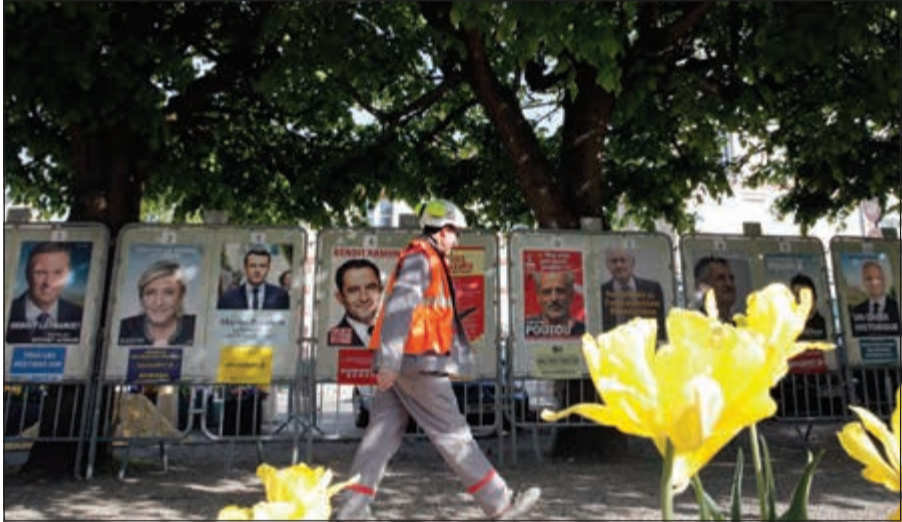
فرنسي يمر بجوار ملصقات انتخابية لمرشحي الرئاسة بأحد ضواحي باريس امس