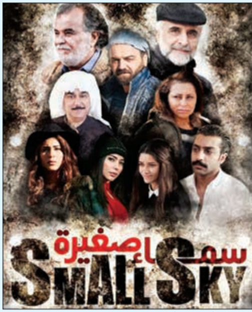
بوستر مسلسل «سما صغيرة».

وأشارت إلى أنها لم تستقر على العمل الذي ستشارك فيه في موسم عيد الفطر السعيد المسرحي، وإنما ما زالت في مرحلة القراءة لبعض النصوص التي قدمت لها، مؤكدة أن حال المسرح الكويتي بخير وأن عدد المنتجين في تزايد في كل عام وأنه لا توجد حالة فقور منه. وكشفت زهرة الخرجي أنها تفكر جديا الدخول في تجربة إنتاج أعمال مسرحية وتلفزيونية، لكن هناك بعض الأمور التي تحتاج إلى تعديل قبل أن تشرع في هذه الخطوة، لتكون على مستوى توقعات المشاهدين.