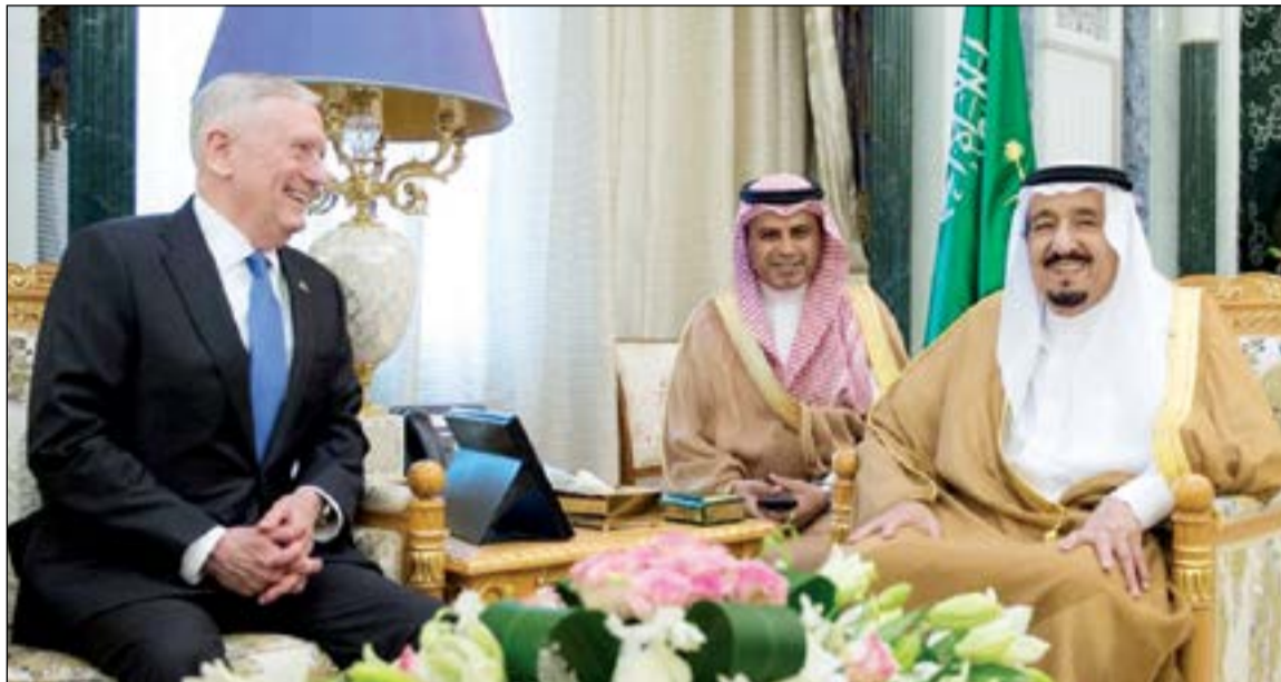
خادم الحرمين الشريفين الملك سلمان بن عبدالعزيز خلال استقباله وزير الدفاع الأميركي جيمس ماتيس (واس)

الرياض - وكالات: استقبل خادم الحرمين الشريفين الملك سلمان بن عبدالعزيز بقصر اليمامة أمس، وزير الدفاع الأميركي جيمس ماتيس. وذكرت وكالة الأنباء السعودية الرسمية «واس» في بيان أنه جرى خلال الاستقبال، بحث سبل تعزيز علاقات الصداقة الاستراتيجية بين المملكة والولايات المتحدة الأميركية وبخاصة في المجال الدفاعي، وتطورات الأحداث الإقليمية والدولية.