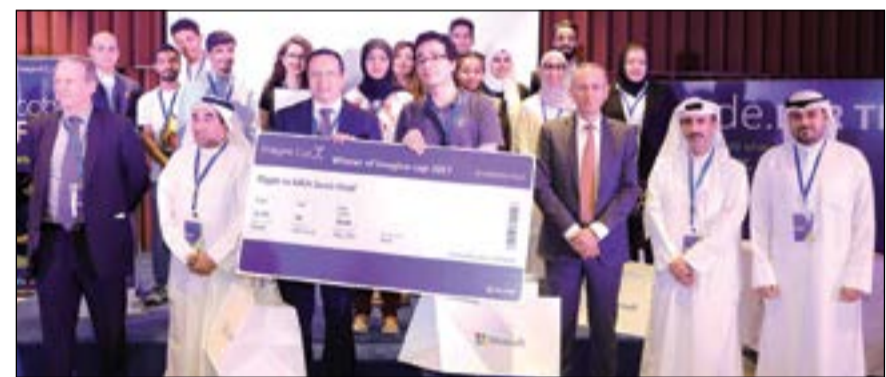
تكريم الفرق الفائزة

فازت فرق «NOCTURNE» و«FEHOT» في النهائيات الوطنية لكأس التخييل 2017 للكويت، وهي المسابقة الطلابية الأكبر في مجال تكنولوجيا المعلومات حول العالم، وتهدف إلى توفير فرص تعليمية وريادية للطلاب والشباب عن طريق اكتساب المهارات اللازمة لتمكينهم من تحقيق تلك الأهداف.