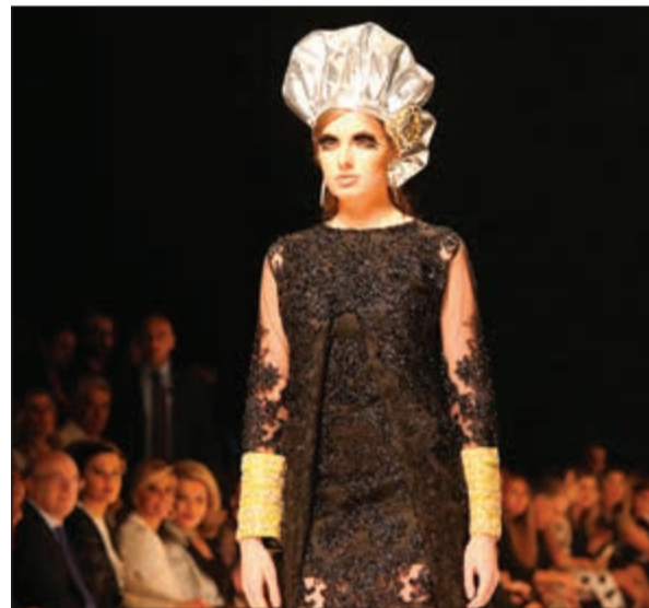
أحدى المشاركات في العرض

الأمير البريطاني وليام يؤكد انه اتفق مع زوجته كيت على تشجيع أطفالهما للتحدث عن مشاعرهم وعدم كبتها، وذلك بعد ان كشف شقيقه هاري قبل أيام مدى ما عاناه نفسيا بعد وفاة أمه الأميرة ديانا في حادث سير مروع.