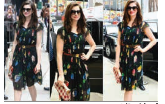
النجمة آن هاناواي

نيويورك - وكالات: ظهرت النجمة آن هاناواي صباح أمس في البرنامج التلفزيوني الشهير «صباح الخير أمريكا» في ثوب ربيعي أنيق منقوش بالزهور. الفستان الذي كان ملائما جدا لهاواي بدا وكأنه مصمم خصيصا لها، ولكنها أوضحت أنها اشتريته من سوق للأشياء القديمة والمستعملة مقابل 15 دولارا فقط. وحسب موقع «إن ستايل»، للموضة، قالت هاناواي للكاميرات: أحاول أن أكون أكثر استدامة مع خيارات الأزياء الخاصة بي، لذلك أحاول ارتداء الأزياء الـ vintage أينما كنت. وأشار موقع الموضة إلى أنه من الرائع رؤية المشاهير يتجهون لمثل هذه الخيارات الصديقة للبيئة.