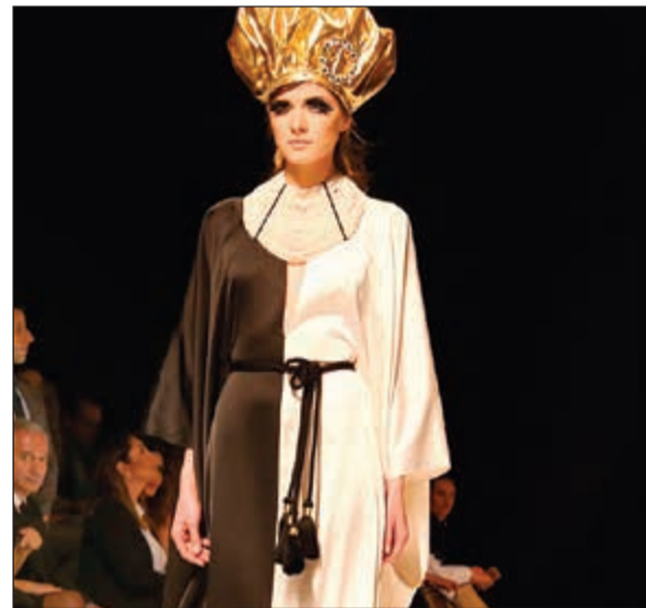
جانبا من العرض

أرقام الجريدة - البداية: 22272727 - 22272728 - إدارة التحرير: 22272828 - 22272829 - إدارة التسويق والمبيعات: 22272743 - 22272746 - قسم حجوزات الإعلان: 22272750 - 22272751 - إدارة التوزيع والأشتراكات: 22272770 - 22272737 - قسم الشكاوى 22272737