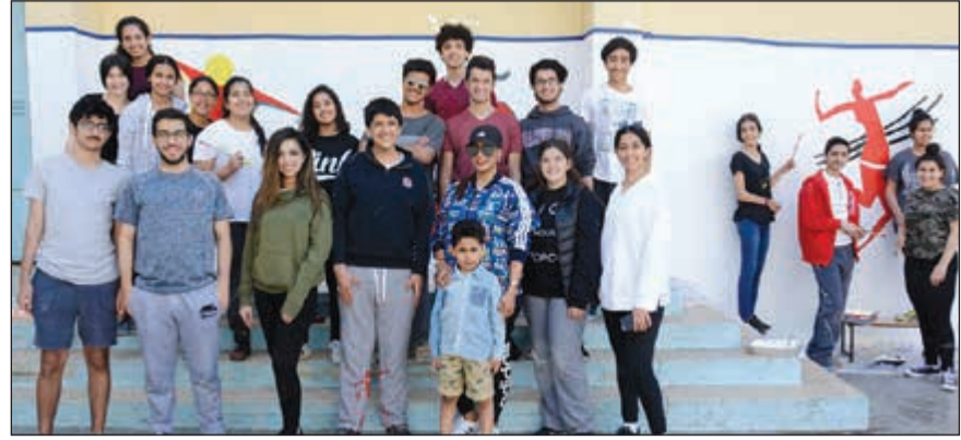
مجموعة «يدا بيد»

أعرب بنك برقان، ثاني أكبر البنوك التقليدية في الكويت، عن فخره باستمرار رعايته لأنشطة مجموعة «يدا بيد» (Hand In Hand)، أكبر مجموعة تطوعية طلابية كويتية تحت سن 18 عاما.