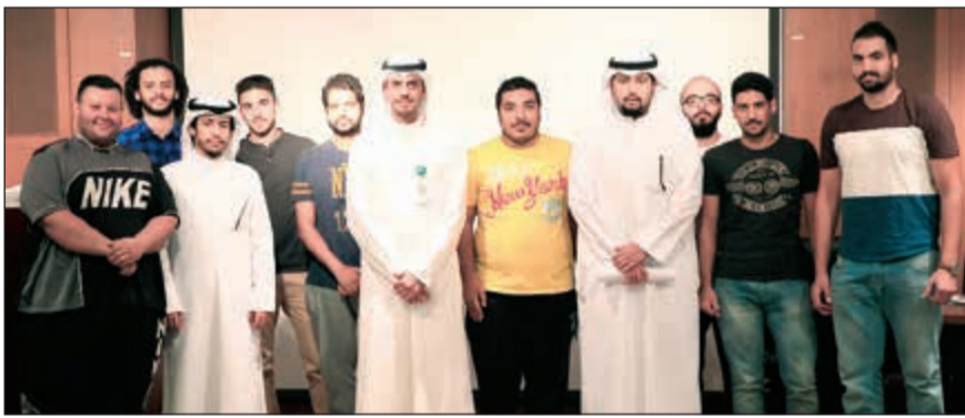
مجموعة من طلبة كلية الهندسة مع مسؤولي العلاقات العامة في «بيتك»

نظم بيت التمويل الكويتي (بيتك) لقاء تعريفيا لطلبة كلية الهندسة والبتروك بجامعة الكويت المشمولين بالرعاية من قبله، حيث يحرس «بيتك» في كل فصل دراسي على دعم أكثر من 35 مشروع تخرج لطلبة الكلية تخدم أكثر من 120 طالبًا وطلبة وذلك انطلاقًا من مسؤولية «بيتك» الاجتماعية وتأكيدًا للدور الرائد في دعم الشباب والطلبة والمسيرة التعليمية وأثرها المشاريع الهندسية التي يقدمها الطلبة والتي تعود بالنفع على المجتمع. وخلال اللقاء استعرض المشاركون من الطلبة أصحاب المشاريع برعاية «بيتك» عدا مناهج، وقد تدرجت لتشمل العديد من الجوانب الصناعية والمدنية والبنية التحتية السنوية وغيرها على اختلاف التخصصات، وسيساهم الطلبة بمشاريع تخرجهم في معرض التصميم الهندسي المزمع إقامته في 21 و22 مايو