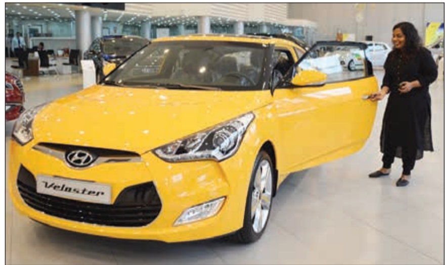
الفائزة تتسلم السيارة

بعد إطلاق هيونداي «شمال الخليج»، عرضها المميز الذي يوفر للعميل لدى شراء سيارة هيونداي جديدة فرصة دخول السحب لربح سيارة فيلوستر طراز 2017 مع باقة من الميزات الرائعة، جرى السحب بتاريخ 5 أبريل 2017 في معرض هيونداي - الشويخ الساعة 11 صباحاً، حيث حضر عدد من المدعوين، بإشراف ممثلين عن الوزارة، مدير صالة العرض وفريق التسويق.