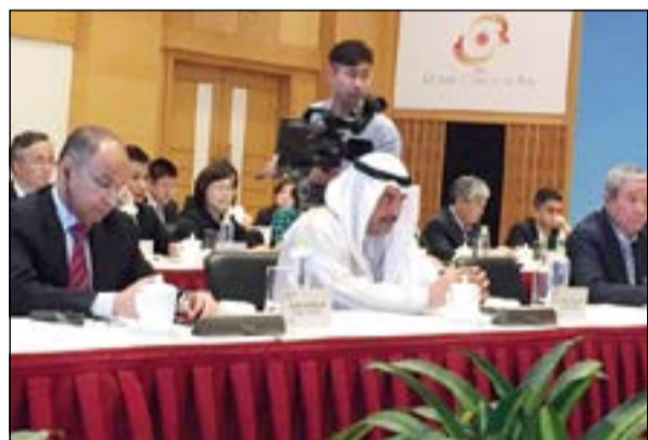
رئيس المجلس الأولمبي الآسيوي الشيخ احمد الفهد وحسين المسلم خلال افتتاح مقر اللجنة المنظمة لدورة الألعاب الآسيوية التاسعة عشرة عام 2022

إلى ذلك، شهدت مدينة هانغزو الصينية امس توقيع اتفاقية شراكة بين المجلس الأولمبي الآسيوي وشركة علي سبورت علي بابا، سيكون من أبرز نتائجها تنظيم مسابقات الألعاب الإلكترونية بدءا من دورة الألعاب الآسيوية الثامنة عشرة عام 2018 في اندونيسيا.