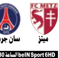
سان جرمان ميتر

ويملك ستيت فرصة تحقيق الفوز على الثاني غدا الأربعاء عندما يخوض المباراة الثانية على أرضه أيضا، قبل ان يخوض مباراتين في بورتلاند، ثم يعود إلى ملعبه لخوض المباراة الخامسة في حال لم يحسم مواجهة في صالحه، ومن ثم المباراة السادسة ببورتلاند والسابعة الأخيرة في أوكلاند إذا اقتضت الضرورة.