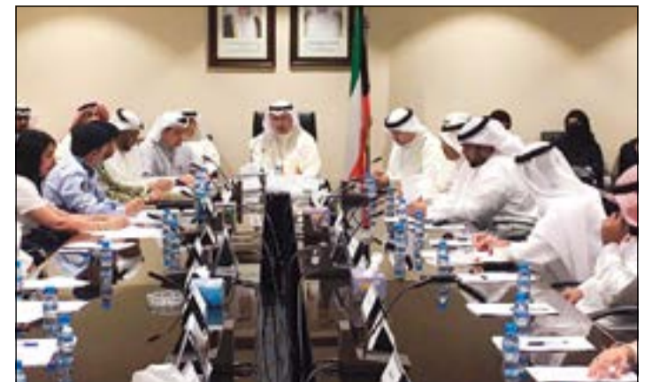
م.عصام المرزوق مترئسا الاجتماع التاسع والعشرين للجنة التنفيذية لترشيد استهلاك الطاقة

أعلن الوكيل المساعد لقطاع التخطيط والتدريب في وزارة الكهرباء والماء د.م.عصام المرزوق عن انتهاء الوزارة من تحديث خطة الاحتياجات المستقبلية للطاقة الكهربائية والمائية، مبيّناً أنه تمت الاستعانة بمكتب استشاري عالمي لتنفيذ هذه الاستراتيجية بهدف دراسة التوسع المستقبلي لشبكات الكهرباء والماء.