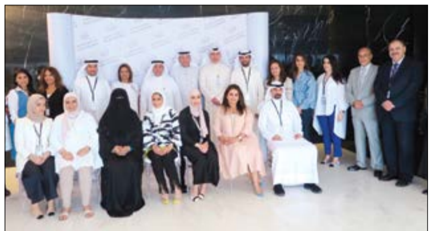
صلاح المصنف مع بعض المكرمين

وأكد أن البنك سيواصل تنظيم وإقامة مثل هذه الدورات التدريبية التي تلبى احتياجاته في أعداد وتنفيذ الميزانية بحرفية وكفاءة عالية، موضحاً أن التدريب البشري يبقى الوسيلة الأكثر نجاحاً وفعالية لتحقيق التنافسية ورفع مستوى الخدمة، والسعي الأمثل لاستثمار المورد البشري.