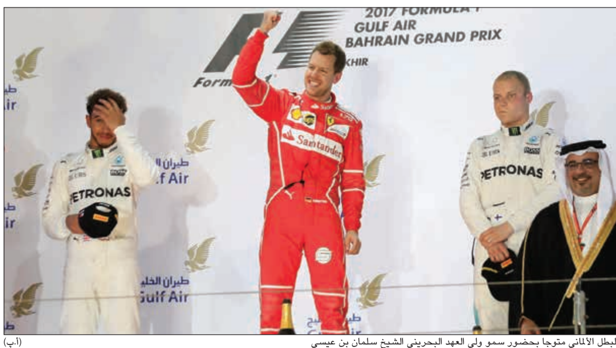
البطل الألماني متوجا بحضور سمو ولي العهد البحريني الشيخ سلمان بن عيسى

أحرز الألماني سيباستيان فيتل «فيراري» المركز الأول في سباق جائزة البحرين الكبرى، المرحلة الثالثة من بطولة العالم لسباقات الفورمولا واحد على حلبة صخير. وتقدم فيتل على سائق مرسيدس، بطل العالم في الموسم قبل الماضي البريطاني لويس هاميلتون، والفنلندي فاليري بوتاس. وأنهى فيتل السباق البالغة مسافته 308 كلم، بزم قدره 1:33.53.373 ساعة، أي بمعدل سرعة وسطي بلغ 196.979 كلم، متقدما بفارق 6,6 ثوان عن هاميلتون، و20,397 عن بوتاس. والفوز هو الثاني لفيتل هذا الموسم، والرابع والأربعون في مسيرته في بطولة العالم للفورمولا واحد، كما أنه الثالث له في البحرين بعد 2012 و2013. وكان فيتل فاز بالمرحلة الأولى في استراليا أمام هاميلتون بالذات، في حين حل ثانيا في المرحلة الثانية في الصين خلف البريطاني أيضا. وانفرد الألماني بطل العالم اربع مرات متتالية مع فريق ريد بول بين 2010 و2013، بصدارة ترتيب بطولة العالم برصيد 68 نقطة مقابل 61 نقطة لهاميلتون. وكان بوتاس انطلق من المركز الأول للمرة الأولى في مسيرته، أمام هاميلتون وفيتل. وانضم بوتاس إلى مرسيدس خلفا للألماني نيكو روزبرغ الذي اعتزل بعد أيام معدودة على تتويجه بلقب الموسم الماضي.