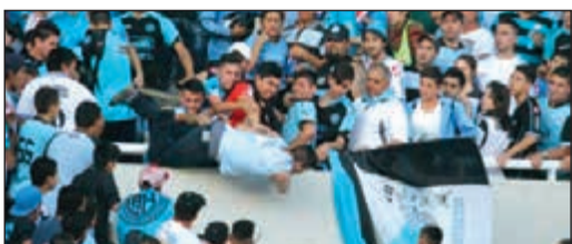
مشجعو بلقرانو أثناء الاعتداء بالضرب على المشجع وقذفه من المدرجات

ذكرت الشرطة الأرجنتينية أمس أن مجموعة من مشجعي نادي بلقرانو اعتدوا بالضرب على مشجع شاب وقذفوا به من المدرجات خلال مباراة الفريق أمام جاره تاليريس كوردوبا والتي انتهت بالتعادل 1-1 ضمن منافسات الدوري الأرجنتيني لكرة القدم. ونقل المشجع الشاب إلى المستشفى في حالة سيئة وخطيرة وذلك لتلقي العلاج. وحدثت الواقعة بين شوطي المباراة بمدينة كوردوبا التي تبعد نحو 800 كيلومتر شمال العاصمة الأرجنتينية بوينس آيرس.