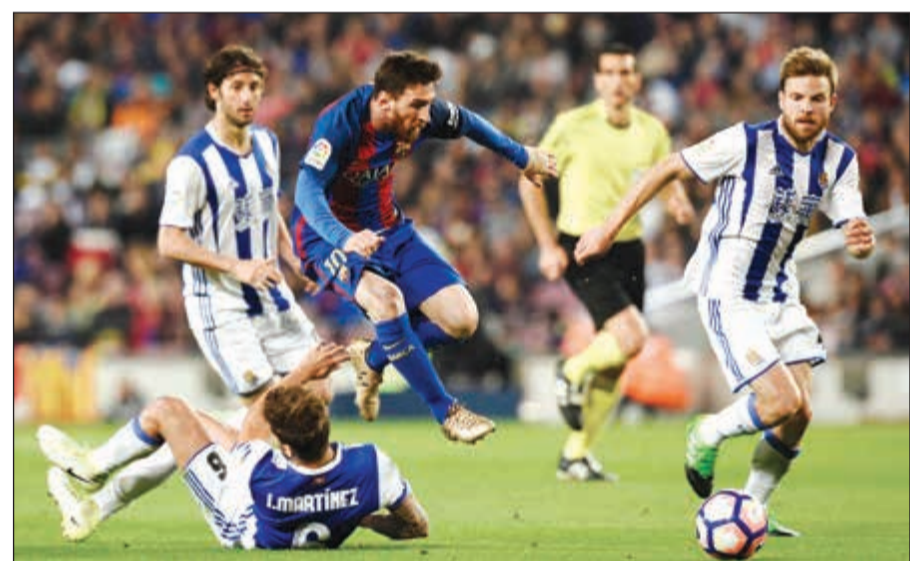
ليونيل ميسي يتجاوز لاعب سوسبيداد مارتينيز

وأهدر اشبيلية الرابع نقطتين بتعادله مع مضيفه فالنسيا سلبا، ليرفع رصيده إلى 62 نقطة، بفارق ثلاث نقاط خلف اتلتيكو مدريد الثالث الذي تغلب