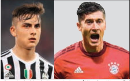
ليغاندوفسكي جاهز للثلاث من الريال وديبالا للحفاظ على النتيجة

أكمل مهاجم بايرن ميونخ روبرت ليفاندوفسكي الحصص التدريبية أمس بشكل كامل، بعدما تعافى من الإصابة التي لحقت به الأسبوع الماضي، بكمية من الكتل، خلال مواجهة بوروسيا دورتموند باليونديسليغا. وقال الدولي البولندي، في تصريحات للموقع الرسمي لناديه أمس: «أنا بخير. أنا سعيد جدا، لأنني تمكنت من أداء التدريبات الجماعية اليوم». وفي السياق ذاته، قال موقع «سبورت1» الألماني، إن ماتس هوميلز، مدافع الفريق البافاري، تدرّب بدون كرة اليوم، لمدة 25 دقيقة تخللها تدريبات تغيير الاتجاه، ومن المقرر أن يسافر الدولي الألماني مع فريقه إلى مدريد. وأضاف الموقع: «فيما تبدو فرص لحاق جيروم بوتينغ بالمباراة ضعيفة للغاية، وسيكون معرضا لإصابة خطيرة في الفخذ، إذا ما تحمل على نفسه، وخاض مباراة الإياب». من جهتها، ذكرت تقارير صحافية إيطالية أن الثقة تملأ أرجاء نادي يوفنتوس حول عودة المهاجم الأرجنتيني بالو ديبالا، والمشاركة في اللقاء المرتقب أمام برشلونة في معقله «كامب نو».