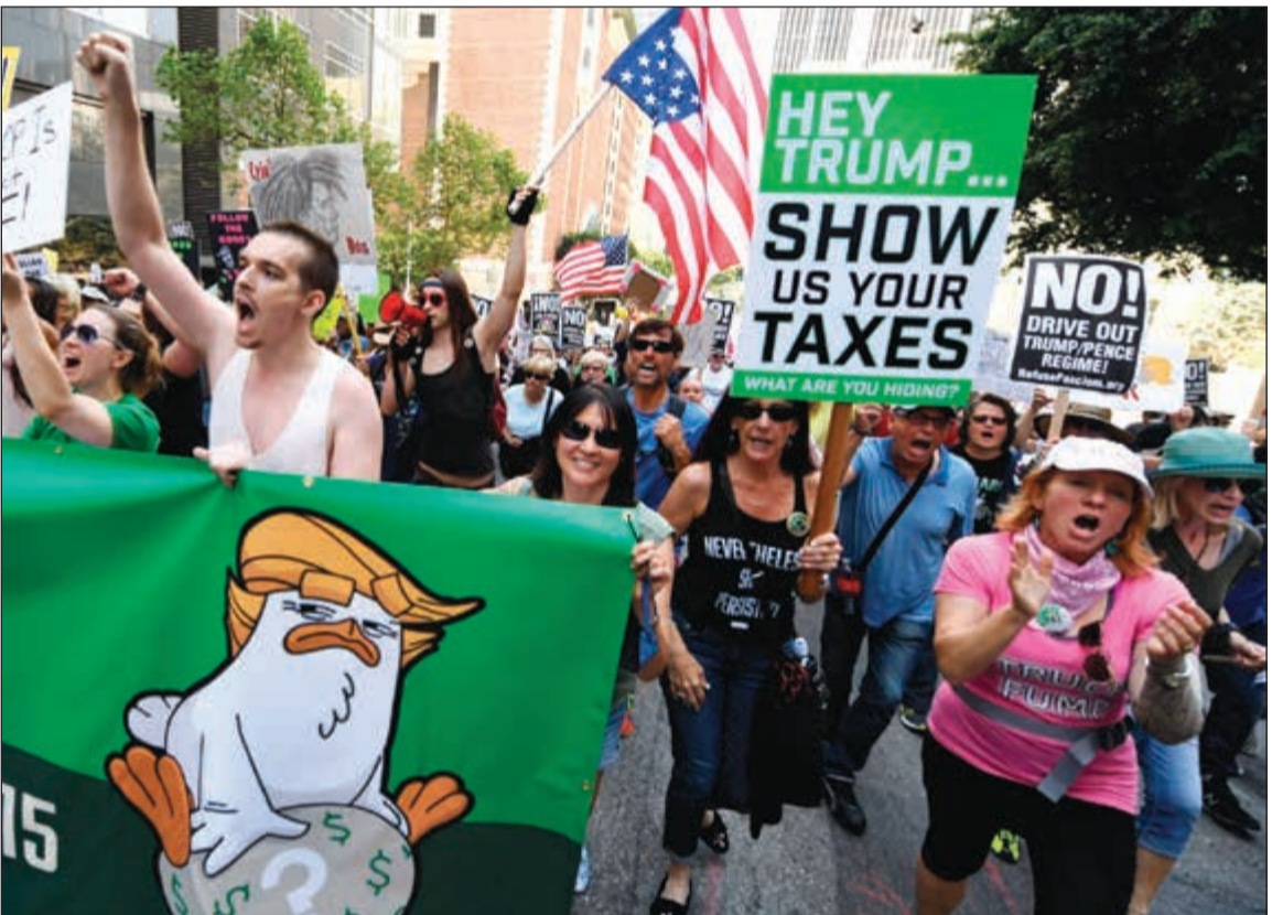
متحتجون يرفعون لافتات تطالب ترامب بكشف سجله الضريبي خلال مسيرة في لوس أنجلوس أمس الالول

بفصل بينهما، لجأت الشرطة إلى استخدام شحنة متفجرة لاحتواء المظاهرات. وأكدت مصادر عسكرية في المنطقة العسكرية الخامسة والمشاركة في عملية السهم البحري لـ «الأنباء» ان وحدات الجيش الوطني تمكنت خلال عمليات التمشيط الأولية من الكشف عن كمية من أسد وخطر الألغام البحرية الإيرانية والتي تحتوي على مادة فولاذية شديدة الانتشار ومزودة بمادة الفسفور فايف وتم تطويق المنطقة