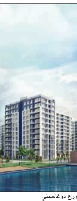
مشروع بلوليك بالكامل،

عدد الغرف بالبرج 60 غرفة وبه عدد 80 جناحاً يسع تقريبا 1000 حاج، ويشتمل على دور خدمات وآخر مصلى ودورين مواقف سيارات ودور أرضي كاستقبال ودورين للمناسبات بسلاطم داخلية وعدد 2 مسبح، وبه صالة مناسبات علوية بمساحة 650 متراً مربعاً بالإضافة إلى المطعم والميزانين وخزان أرضي وبيروم، ونظراً للمشروع تحت شعار (جوار الحرم المكي مع دار الجوار العقارية)».