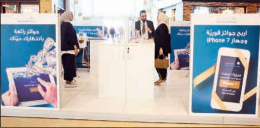
جناح البنك الأهلي المتحد في الجيت مول خلال الحملة

حصلوا عليها. وأشار البنك في بيان صحافي إلى أن هذه الفعالية جاءت انطلاقاً من حرص البنك على مكافأة عملائه أولاً، والتوعية حول برنامج الحصاد الإسلامي الذي يعد الكويت المتوافق مع الشريعة الإسلامية.