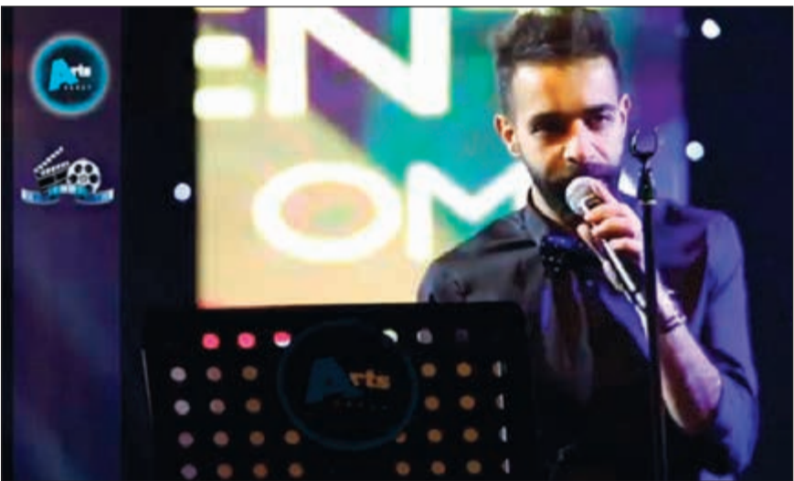
الويس أمتع الجمهور بغناؤه

أحيا النجم عبدالعزيز الويس حفلاً غنائياً ساهراً في أرض المعارض الدولية، وذلك ضمن أنشطة معرض «هنا الكويت» بمشاركة الفنان الإماراتي محمد الشحي، وقدم لويس مجموعة