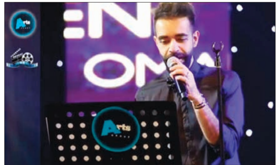
النجم الويس في فقرة غنائية