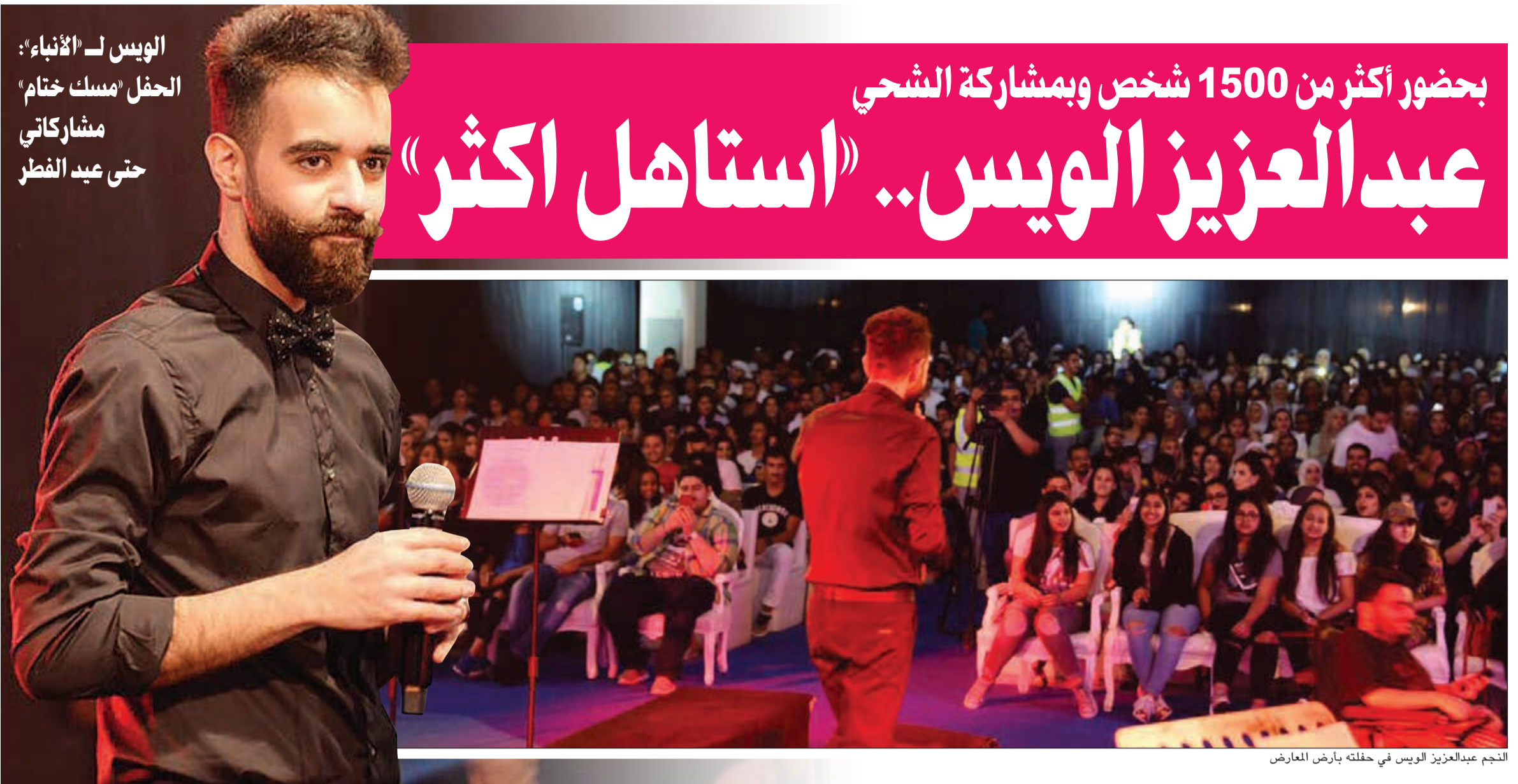
النجم عبدالعزيز الويس في حفلة بآرض المعارض

طول ايام المهرجان والذي لم يقل عن ألف وخمسمائة شخص في كل حفلة على اقل تقدير.