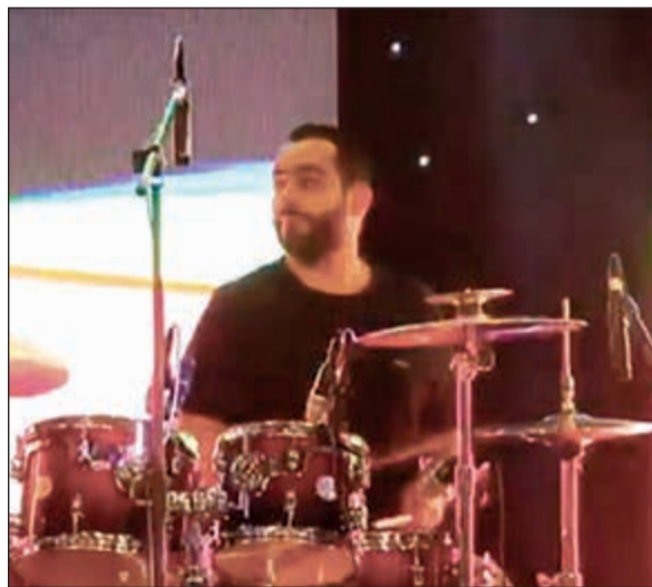
جانب من الفرقة الموسيقية