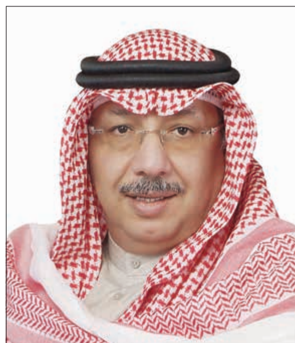
الشيخ محمد جراح الصباح

أعلن بنك الكويت الدولي عن تحقيقه 7,6 ملايين دينار أرباحاً صافية بنهاية الربع الأول من عام 2017، لترتفع بنسبة 13% مقارنة بالفترة ذاتها من العام الماضي والتي بلغت نحو 6,7 ملايين دينار. وفي هذا السياق، قال رئيس مجلس إدارة بنك الكويت الدولي الشيخ محمد جراح الصباح إن الأداء القوي للبنك والنتائج المالية الإيجابية التي سجلها حتى نهاية الربع الأول من هذا العام، تبين مدى متانة وضع «الدولي» المالي وسلامة الاستراتيجية التي وضعتها، خصوصاً في ظل التحديات وظروف السوق الاقتصادية المحلية والإقليمية.