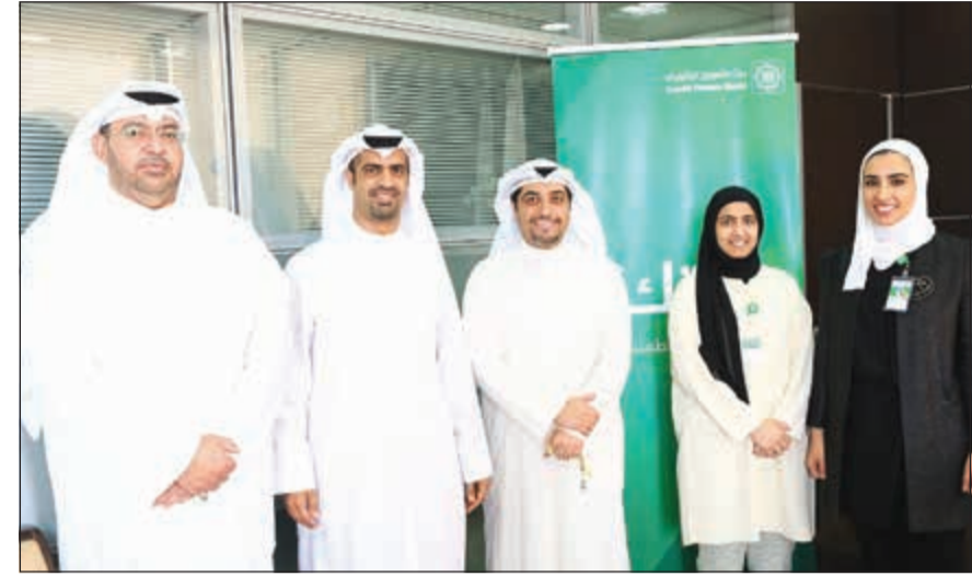
جانب من إعلان الفائزين

اهتماماتها المتعددة، بحيث تتناسب مع كل شرائح العملاء وتلبي احتياجاتهم في الحصول على خدمة متميزة وفق معايير وأساليب لا تقل عن نظيرتها العالمية من حيث الجودة والدقة والسرعة. ويعبر «حسابي» للشباب عن طموح وتطلعات وخصائص هذه الشريحة، وينسجم مع توجهات «بيتك» نحو استقطاب أكبر عدد ممكن منهم، حيث يمثل الشباب نسبة كبيرة من المجتمع الكويتي، كما يمثل مبادرة من «بيتك» نحو تنوع المنتجات والخدمات المصرفية، ومن أهم المزايا التي يتم تقديمها ضمن برنامج «حسابي» للشباب حصول عملاء شريحة الشباب على