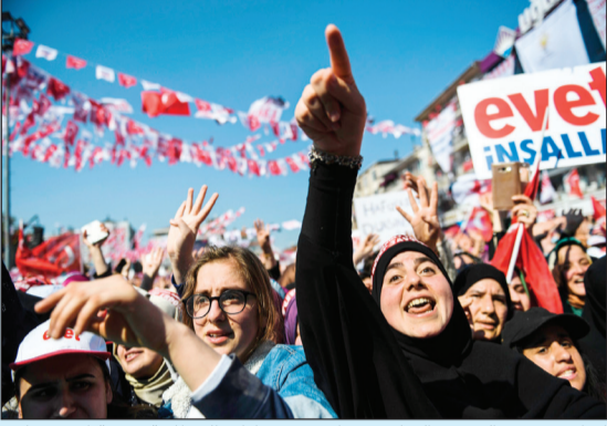
اتراك يحيون الرئيس التركي في اخر مهرجاناته الخطابية عشية الاستفتاء على التعديلات الدستورية (أ.ف.ب)