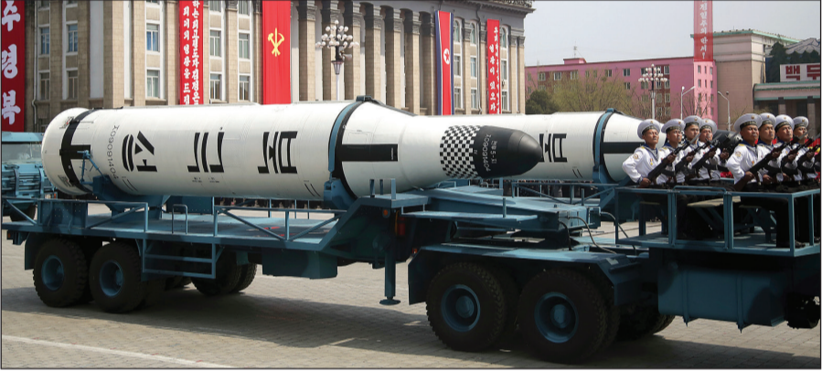
صاروخ من طراز بوكوك سونغ يطلق من الغواصات تكشف عنه بيونغ يانغ لأول مرة

عواصم - وكالات: صعدت كوريا من تحديها للرئيس الأميركي دونالد ترامب، وأجرت استعراضا عسكريا ضخما كشفت فيه عن صواريخ جديدة طويلة المدى وأخرى من طراز بوكوك سونغ التي تطلق من على غواصات لأول مرة، وذلك ضمن أحيائها الذكرى الخامسة بعد المائة لميلاد مؤسس البلاد كيم إيل سونغ، وقالت وكالة الأنباء المركزية الكورية إن «الهيستيري العسكرية الخطيرة» في إدارة ترامب وصلت إلى «مرحلة خطيرة لم يعد من الممكن تجاهلها»، ملوحة بالرد بالأسلحة النووية على أي هجوم مماثل قد يستهدف البلاد.