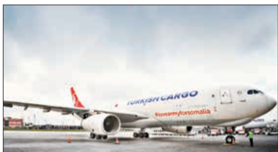
الناقلة الوحيدة التي تسير رحلاتها إلى الصومال

الحملة الأنظار، وتابعها مجلس إدارتنا عن كذب، وفي غضون ساعة قمنا بالتواصل مع جبروم عبر الهاتف، وكانت الخطوط الجوية التركية قد عملت مع هذا المستخدم الفرنسي الشهير لموقع يوتيوب في أعوام سابقة على مشاريع رقمية ماضية. وعقب الرد بأن الخطوط الجوية التركية ترغب في تلبية النداء سريعاً، قام جبروم من 5 من أصدقائه من مدينة نيويورك بإنشاء محتوى مع الوسم TurkishAirlinesHelpSomalia# تلاحقهم وتساعدنا من خلال وسم TurkishAirlinesHelpSomalia# في يوم الأربعاء الموافق 15 مارس الماضي. وعقب هذا النداء، أضافت حسابات ريفية المستوى على تويتر، بما في ذلك نجم هوليوود الممثل بن ستيلر، أصواتها لنداء الخطوط الجوية التركية لدعم هذه الحملة. وسرعان ما لفتت هذه