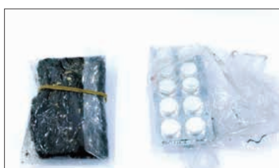
قطع الحشيش والحبوب