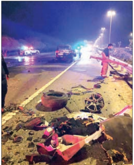
رجال الإنقاذ هرعوا إلى الحادث