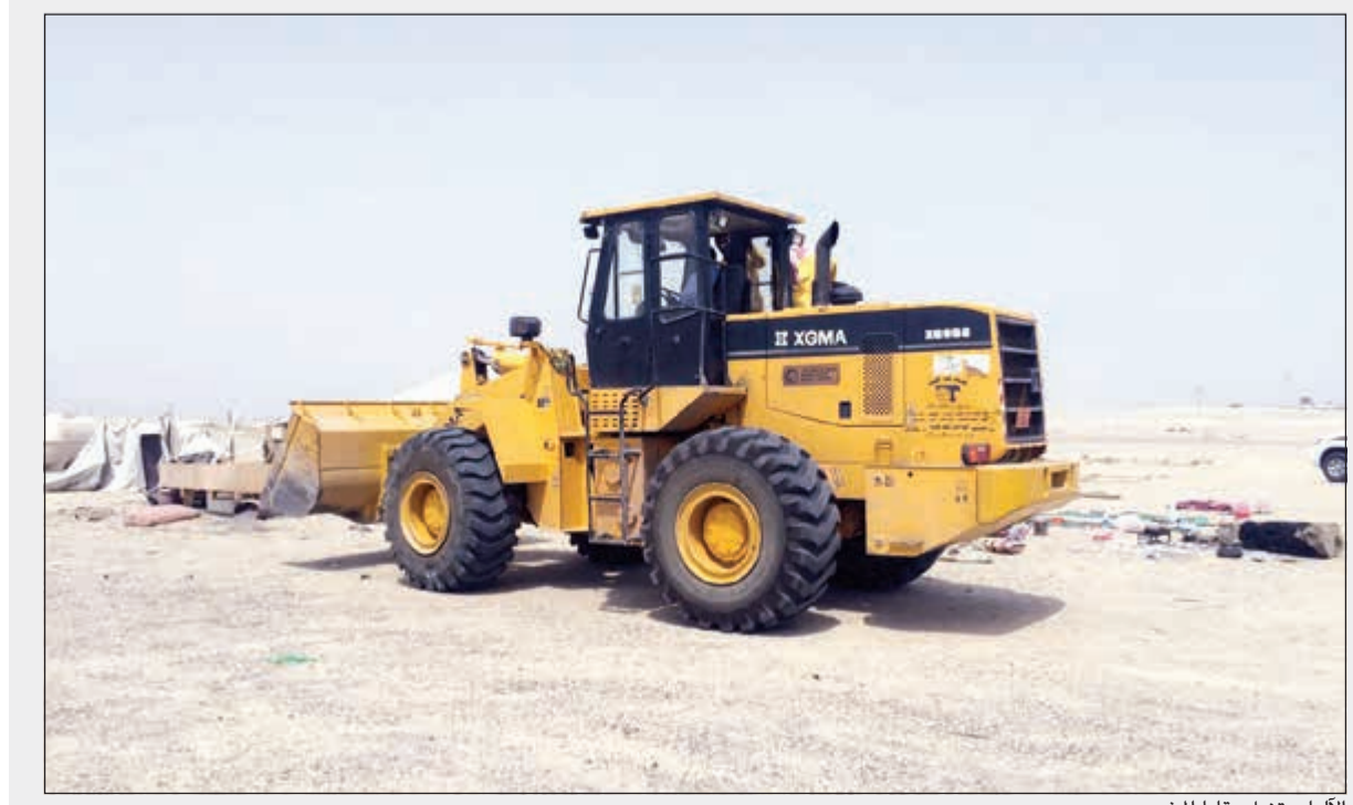
الآليات تزيل بقايا المخيم