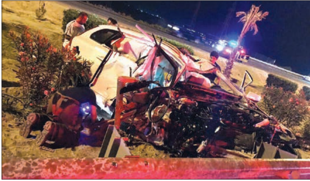
حطام إحدى السيارات

قدم وادع عراقي يعمل ممثلاً قانونياً لإحدى شركات تاجير المركبات بلاغاً إلى مخفر خيطان متهماً شخصاً من غير محدد الجنسية بخيانة الأمانة، وقال العراقي إن المدعى عليه استاجر مركبة من الشركة منذ آخر فبراير الماضي، ولم يسدد قيمة التأجير، ولم يعدها حتى الآن، وأضاف أنه تم الاتصال هاتفياً عليه لكنه لا يرد. وسجلت قضية خيانة أمانة 2017/155 جنح خيطان وأحيلت إلى جهة الاختصاص.