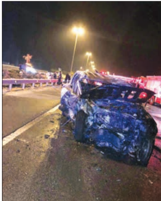
مركبة أخرى محطمة تماما

النجدة والمرور والأمن العام والإنتقاذ، وشوهت عدة مركبات محطمة تماما بالإضافة إلى إصابات بالغة بأشخاص كانوا على متن تلك المركبات بالإضافة إلى حالات انحسار لآخرين وانحسار داخل المركبات، هذا، وقام رجال مركز إطفاء