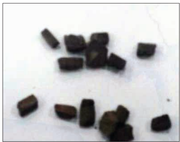
قطع الحشيش المضبوطة مع الوافد