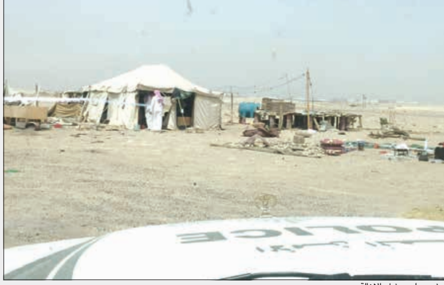
مخيم على وشك الإزالة