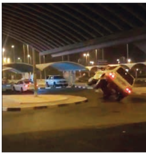
استهتر خطير بدوار الجمعة

مقطع قد تم بثه على مواقع التواصل الاجتماعي يقوم فيه شخص مجهول بعمليات استهتر بالغة التهور في محيط جمعية أم الهيمان، حيث كان يقوم بالسير على إطاري مركبته الرباعية الجانبين، ويصعد بها الرصيف، وذكر مصدر أمني أنه يجري حالياً تحديد المركبة لمعرفة مالكها، وكذلك تحديد وقت عمليات الاستهتر بهدف التعرف على قائدها في ذلك التوقيت وإحالة إلى جهة الاختصاص.