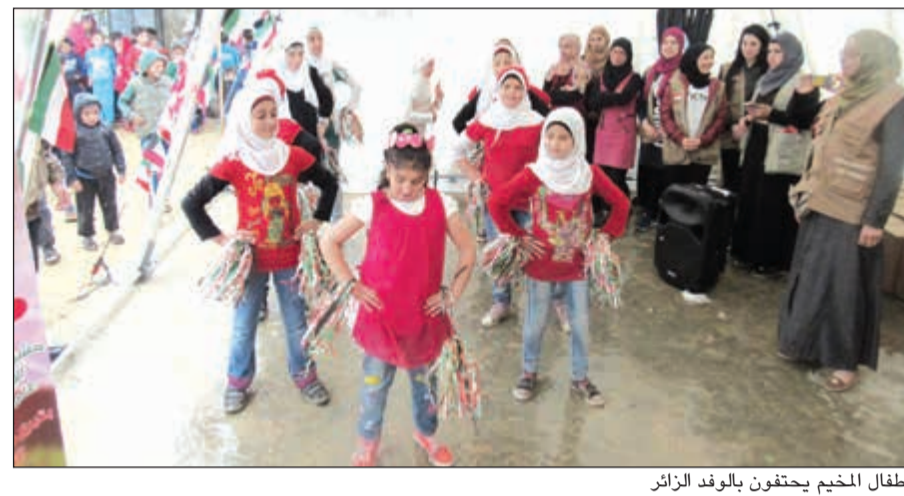
أطفال المخيم يحتفون بالوفد الزائر

وأضاف: «شركتنا مع مجموعة السايير استراتيجية على المستوى العالمي، حيث ان هناك عدة مشاريع مشتركة سواء في الكويت أو في يربوي أو لبنان وغيرها من الدول بدأت بدعم مجموعة السايير للمساعدة العالمية للرسم البيئي». ولفت الى ان هذه الشراكة تترجم حاليا بتنفيذ احد اهم المشاريع لتقديم الدعم لبعض اللاجئين السوريين في لبنان وتحسين ظروفهم الحياتية، مشيرا الى ان وجودهم المؤقت يفرض على المعندين مساعدتهم لتخفيف معاناتهم. وأوضح ابومغلي ان مجموعة السايير قدمت مع الامم المتحدة أجهزة تعمل على