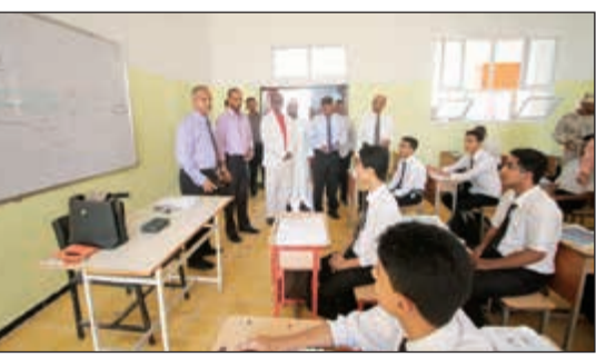
أحد فصول المدرسة

حسين في هذه المناسبة ان التعليم يأتي من اولويات حملة «الكويت إلى جانبكم» ويمثل العمود الفقري فيها من خلال الاسهام في رفق قطاع التعليم بما يلزمه. وذكر البيان ان ثانوية «البيحاني النموذجية» تعد اول مدرسة تدخلت فيها الكويت لتستكمل اعمال صيانتها فيما ستسلم الحملة بقية المدارس بربع محافظات يمنة تباعا وهي «عدن» و«لحج» و«الضالع» و«أبين» والبالغه 51 مدرسة.