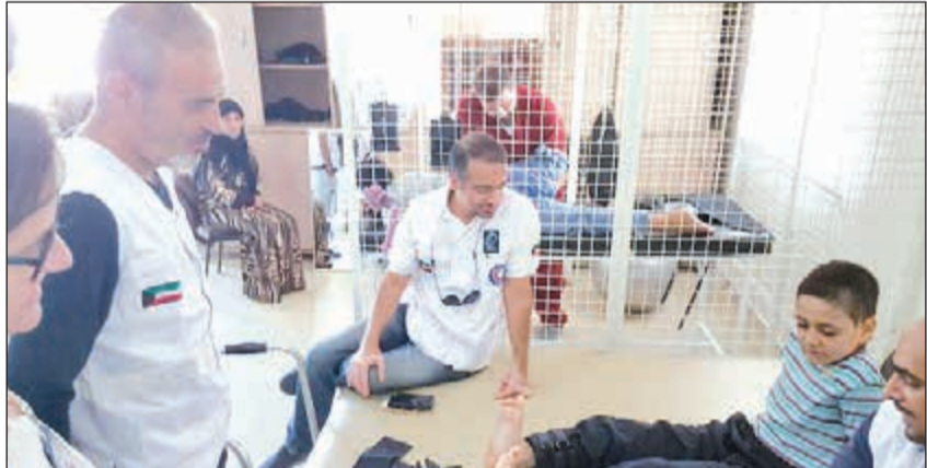
أحد الأطفال السوريين المصابين الذين يستفيدون من مشروع إعادة تأهيل الجرحى المشترك

تصريح ان مشروع التأهيل الجسدي للمصابين المشترك بين اللجنة والهلال الأحمر الكويتي سيساعد الأشخاص ذوي الاعاقة والذين يواجهون نضاي وتحديات كبيرة دون ان تكون لديهم المقدرة للحصول على الرعاية الطبية اللازمة. وقال ان اللجنة الدولية للصليب الأحمر الدولي عمدت أخيرا الى توسيع خدماتها الصحية في لبنان استجابة للحاجات المتزايدة للاجئين والمجتمعات اللبنانية المضيفة وذلك إضافة الى الدعم الذي تقدمه للخدمات الصحية العامة في البلاد.