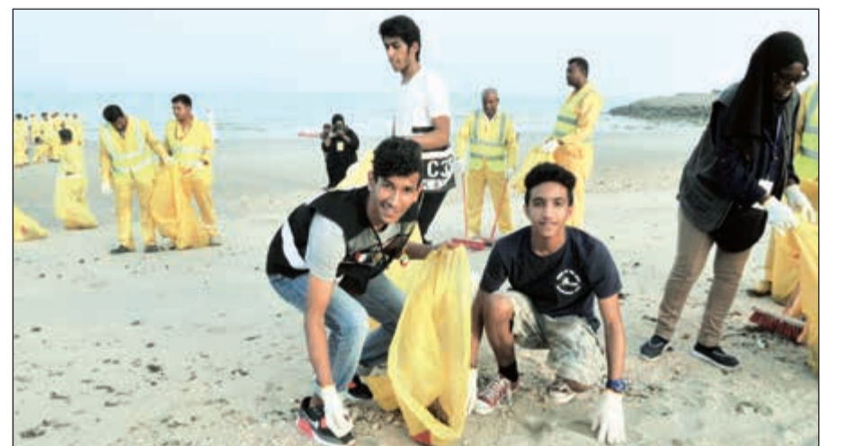
جانب من المتطوعين أثناء تنظيف الشاطئ