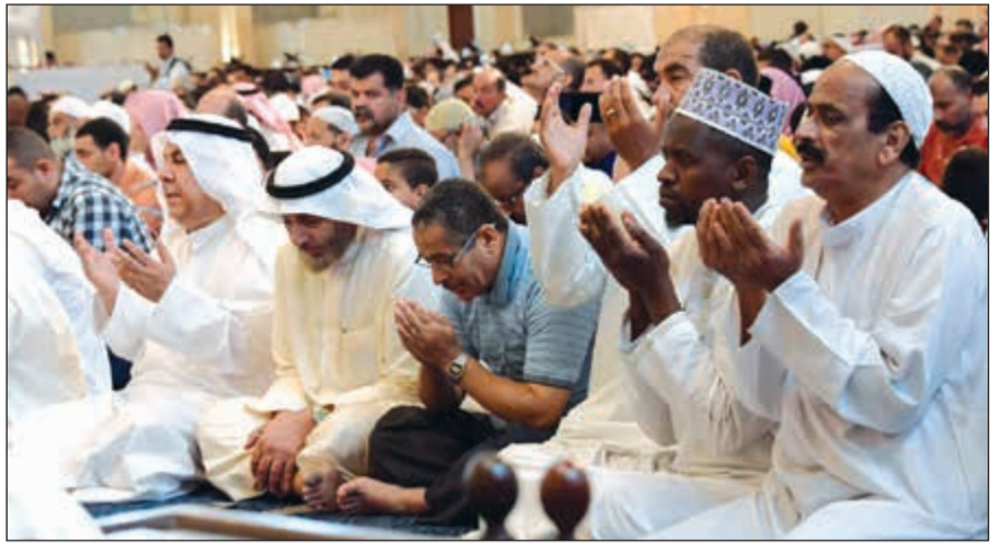
دعاء وإبتهاش بأن يحفظ الله الكويت