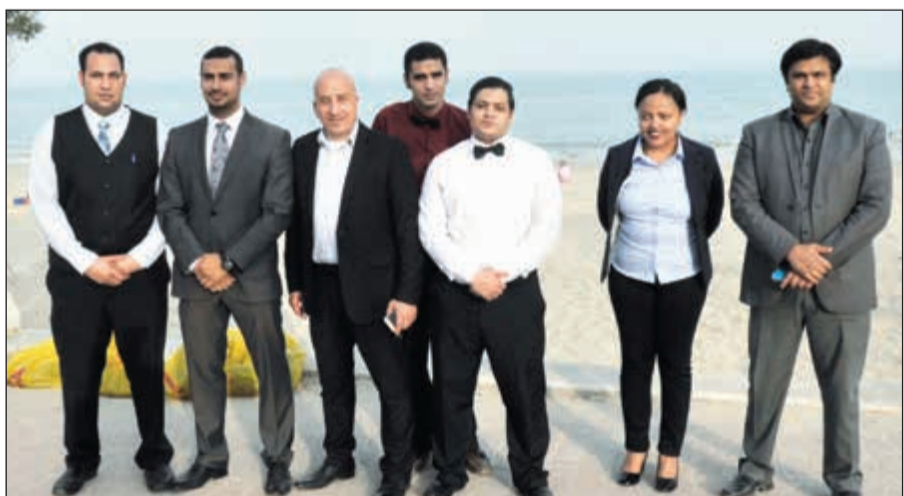
عدد من العاملين بفندق بلاج