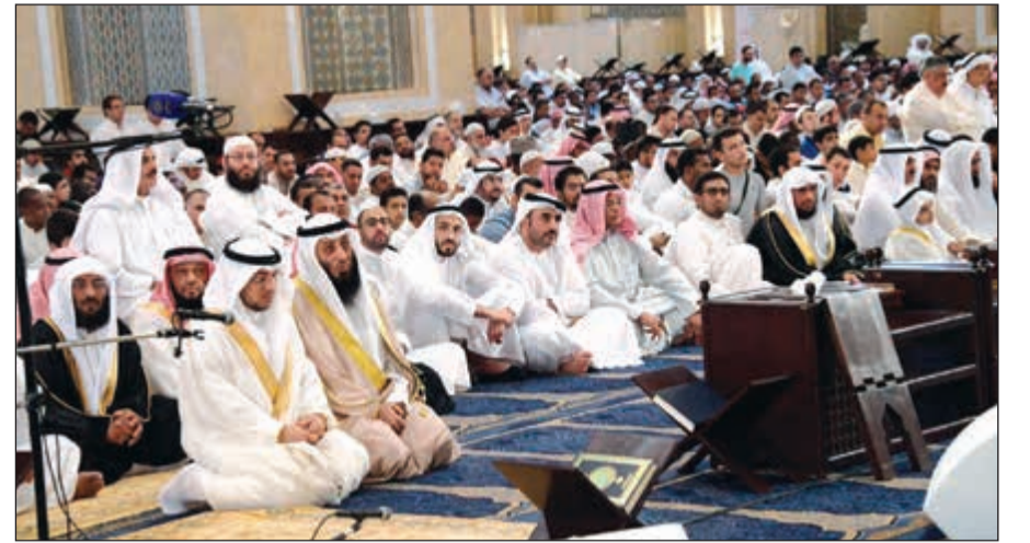
جانب من المصلين

والفتنة فلا تبغفوها، والبيعة فلا تتكفوها، والجماعة فلا تفرقوها، وبلادكم فلا تحاربوها. يا من يسير في فلاة غطشاء، بعين عمشاء.. يا من يقطع أرضاً يهيماء، بلا زاد ولا ماء.. أقصر وأبصر، وانظر واعتبر.. فكم من نفس ندية، وروح زكية، وقعت بحسن نية أسيرة لتنظيمات سرية، وجماعات إرهابية، وتكفيرية وعاشت معها في بلية، ثم صارت لها ضحية! ومن رام الخروج عن سلطان الدولة وظلها، ونظامها ودايرتها إلى الافتئات عليها فقد رام سخطاً ووهماً، وأصاب حدا وجرماً. أيها الآباء والأولياء! خذوا العبرة والعظة، وكونوا الرعاة الحفظة، وأديموا الحذر واليقظة، وحاذروا المتسلل الخفاف، الذي حام حول بيوتكم وطاف، حاذروا الخداع المكار الذي يصنع الأوكار، ويسم الأفاكر، ويغمر الصغار، ويخطف الأغرار. ومتى أبعف الغلام، وشارف الاحتلام، وجب إعطاؤه مزيداً من الرعاية والأهتمام.