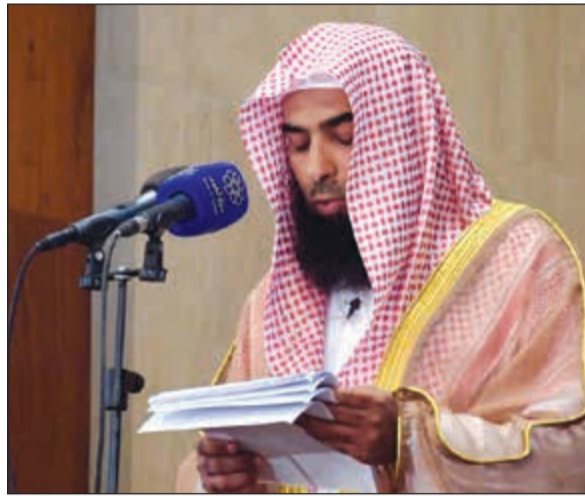
إمام وخطيب المسجد النبوي صلاح البدير خلال الخطبة