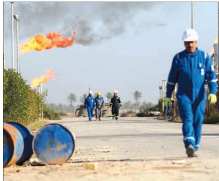
وكالة الطاقة ترفع توقعاتها لنمو الإمدادات من خارج «أوبيك» إلى 485 ألف برميل في 2017

رويترز: قالت وكالة الطاقة الدولية أمس إن سوق النفط العالمية تقترب من استعادة التوازن بعد نحو 3 سنوات من تخمة العرض حيث تعوض تخفيضات إنتاج كبار المصدرين انثر انخفاض الطلب على المدى الطويل في الدول الغنية.