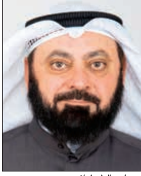
د. وليد الطبيباني

أعلن النائب د. وليد الطبيباني عن تقديمه وعدد من النواب طلب تحقيق حول ما أثير خلال جلسة الثلاثاء الماضي عن زيادات وقفزات في عدد المواطنين بشكل غير طبيعي خلال السنوات الخمس الأخيرة. وقال الطبيباني في تصريح صحفي إن ثبوت صحة ما أثير بشأن وجود تزوير واحتيال في الحصول على الجنسية ووجود عشرات الآلاف من المزورين سيعتبر كارثة وجريمة كبرى. وطالب الطبيباني بتكليف لجنة الداخلية والدفاع بالتحقيق في وجود