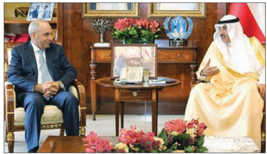
الشيخ صباح الخالد و د.سليمان الجميلي

حضر اللقاء نائب وزير الخارجية السفير خالد سليمان الجارالله ومساعد وزير الخارجية لشؤون مكتب النائب الأول لرئيس مجلس الوزراء وزير الخارجية السفير الشيخ د. أحمد الناصر وسفير الكويت لدى جمهورية العراق السفير سالم الزمانان ومساعد وزير الخارجية لشؤون الوطن العربي السفير عزيز الديحاني ومساعد وزير الخارجية لشؤون التنمية والتعاون الدولي الوزير المفوض ناصر الصبيح وعدد من كبار المسؤولين في وزارة الخارجية.