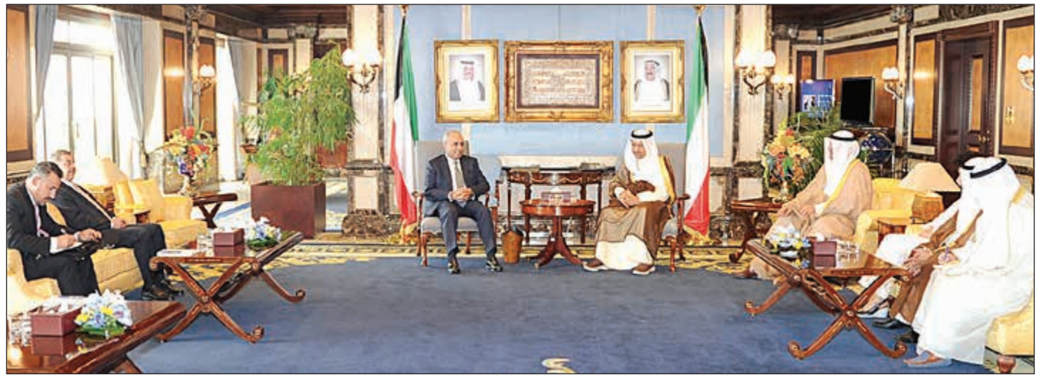
سمو الشيخ جابر المبارك مستقبلاً وزير التخطيط ووزير التجارة العراقي د.سليمان الجميلي والوفد المرافق له

أعلن وزير العدل ووزير الدولة لشؤون مجلس الأمة رئيس مجلس إدارة الهيئة العامة لشؤون القصر د.فالح العزب عن توزيع أرباح بنسبة 11٪ لعام 2016 توزع على الأرصدة النقدية لحسابات القصر والمشمولين برعاية الهيئة. وصرح د.العزب بعد انتهاء اجتماع مجلس إدارة الهيئة المنعقد أمس، أن مجلس الإدارة بحث بعدة قرارات لصالح القصر والمشمولين برعاية الهيئة، وقد تم اعتماد عدة أمور أهمها الميزانية والحساب الختامي للقصر والمشمولين برعاية الهيئة والتقارير السنوي الس 77 عن أعمال الهيئة للعام 2016، وذلك وفقاً