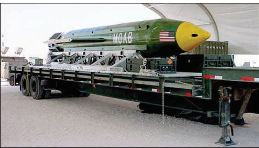
صورة وزعتها قاعدة إيغلين الجوية لأم القنابل التي استخدمتها أميركا في أفغانستان (أ.ب)

وتقلت وسائل الإعلام الأميركية عن عدة مسؤولين في وزارة الدفاع الأمريكية (بنتاغون)، أن القنبلة، التي تزن أكثر من 10 آلاف و300 كغ، تم إلحاقها على موقع لتنظيم «داعش» بولاية «ننغرهان» وشرقي أفغانستان. وذكرت قناة «سي إن إن» عن مصادر عسكرية لم تسمها، أن القصف تم بواسطة طائرة من طراز «إم سي-130» وأنه جرى تطويرها خلال حرب العراق.