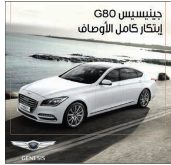
جينيسيس G80 إبتكار كامل الأوصاف

والجدير بالذكر أن المبيعات التي حققتها جينيسيس محلياً أثبتت قدرتها الكبيرة على التميز كسيارة ناجحة وعلامة تجارية استطاعت بوقت قصير منافسة أقدم الشركات الأوروبية واليابانية للسيارات الفاخرة وأكثرها عراقة، حيث أصبحت تجسد نزوة الفخامة والرفاهية إلى أبعد حدود، إلى جانب منعة الأداء في القيادة، بالإضافة إلى ما تمتاز به من مواصفات وما توفره للعميل من مستوى فائق في الأداء والتصميم الراقى والابتكارات الحديثة.