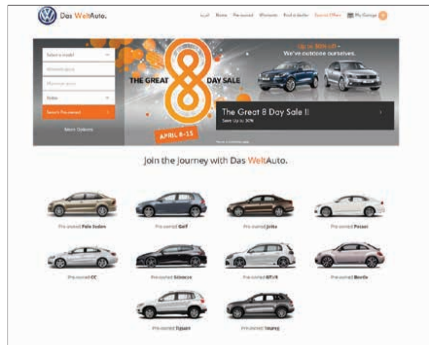
الموقع الإلكتروني الجديد