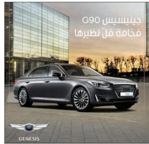
جينيسيس G90 فخامة قل نظيرها

شراؤهم إحدى سيارات G80 و G90 من طرازات 2017 متناولا مواصفات هاتين السيارتين وخصائصهما المميزة التي تحدد مفهوماً جديداً للفخامة التي لا مثيل لها بين منافساتها وتقدم أرفع مستويات الرفاهية والأداء إلى جانب الأمان وأحدث تعبير سيارة السيدان G90 الكبيرة باكورة سيارات