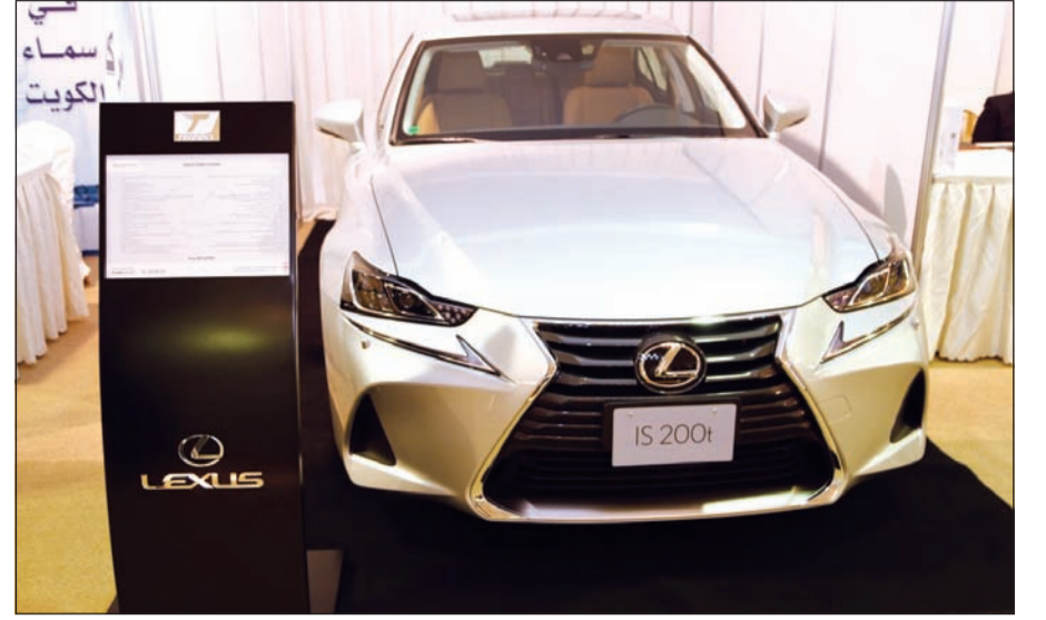
تمتعة عرض سيارة IS 200t

تظهر إحساساً قوياً تجاه التفكير المتقدم والابتكار. وأضاف: لقد كان المعرض ناجحاً جداً من خلال مشاركة الشباب الفعالة في زيارة المعرض للتواصل عن قرب مع سوق العمل بقطاعه العام والخاص.