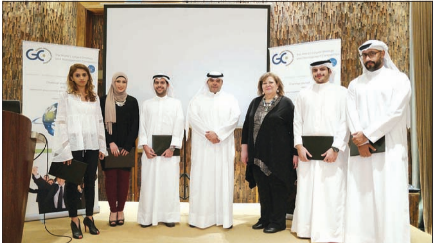
العمومي متوسماً فريق كامكو المشارك في النهائيات

وجامعات ومنظمات أخرى من جميع أنحاء العالم على نيل لقب «التحدي العالمي لأبطال الإدارة 2016». ويعد تحدي الإدارة العالمي، الذي انطلق لأول مرة في عام 1980، أكبر مسابقة محاكاة الإدارة الاستراتيجية من نوعها، حيث يجمع بين منافسين من القارات الخمس عبر منصة محاكاة الواقع، ويحصل كل فريق بشارك في التحدي على فرصة لرؤية تأثير عملية صنع القرار على الشركات الافتراضية من خلال نظام محاكاة للبورصة، وتتكون الفرق من طلاب إدارة الأعمال والموظفين وغيرهم من الأفراد الطموحين، أو مزيج من الثلاثة، بالإضافة إلى ذلك، يحصل المشاركون في التحدي، على شهادة للمشاركة في البرنامج التدريبي الشامل الذي سبق إطلاق التحدي.