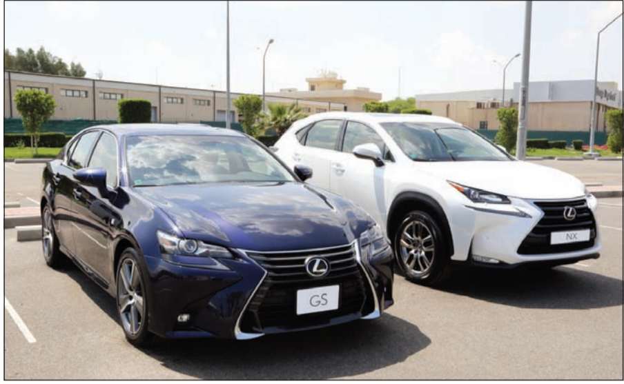
لكزس NX 200t وGS 200t