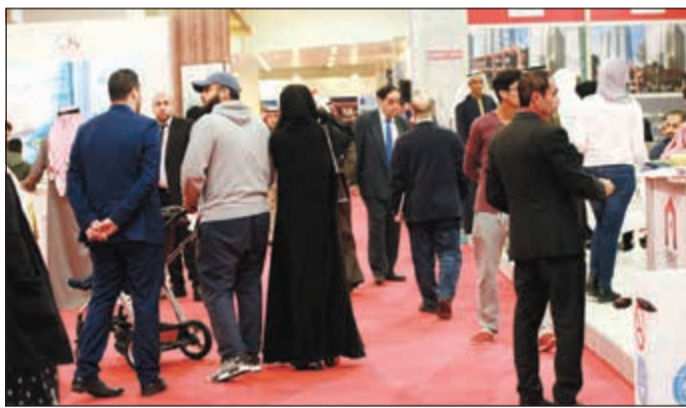
جانب من دورة سابقة للمعرض على أرض المعارض