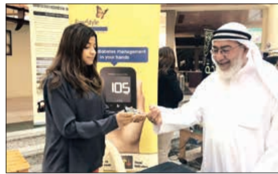
فحص الدم لأحد كبار السن