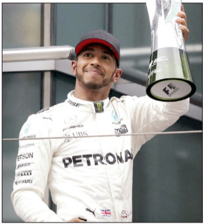
لويس هاميلتون عاد لمنصات التتويج

لها قبل عامين، وكانت أمام أتلتيكو مدريد، أيضا، بعد التحامه مع راؤول جارسيا لاعب الروخيبلانكوس، وغاب عن الفريق 35 يوما. وأشارت الصحيفة إلى أنه «من المتوقع أن يخضع بيبي للمزيد من الفحوصات في عيادة سانتياغو الخاصة بريال مدريد للوقوف على مدى خطورة الإصابة، ومدة غياب اللاعب».