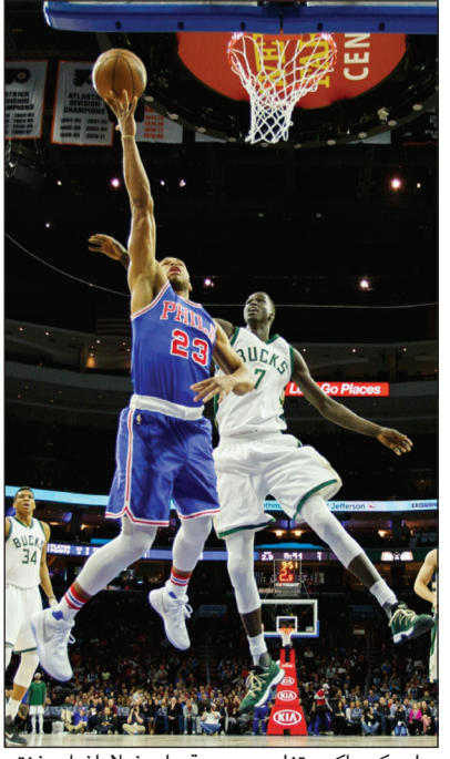
ميلووكي باكس تغلب بصعوبة على فيلادلفيا سفنتي سيكسرز

لحق أتلانتا هوكس وميلووكي باكس بالفارق المتأهله إلى الدور الأول من بلاي أوف دوري كرة السلة الأميركي للمحترفين. وضمن أتلانتا تأهله من دون أن يلعب، في حين تغلب ميلووكي باكس على فيلادلفيا سفنتي سيكسرز 90-82. ويحتل أتلانتا المركز الخامس في ترتيب المنطقة الشرقية برصيد 41 فوزا مقابل 38 خسارة، وميلووكي المركز السادس في المنطقة ذاتها وله 41 فوزا مقابل 39 خسارة. واستفاد أتلانتا وميلووكي من خسارة شيكاغو بولز صاحب المركز الثامن في المنطقة الشرقية أمام بروكلين نتس 106-107 لضمان التأهل إلى الأدوار الإقصائية. والخسارة هي الحادية والأربعون لشيكاغو مقابل 39 فوزا، فبات يتساوى تماما مع ميامي هيت منافسه على بطاقة التأهل والذي تغلب على واشنطن ويزاردز 103-106. كما عزز ألدانيا بيسرز فرصته في اللحاق بركب المتأهلين بفوزه على اورلاندو ماجيك 127-112، حيث يحتل المركز السابع في المنطقة ذاتها. وتأهل الفرق الثمانية الأولى من كل منطقة إلى البلاي أوف.