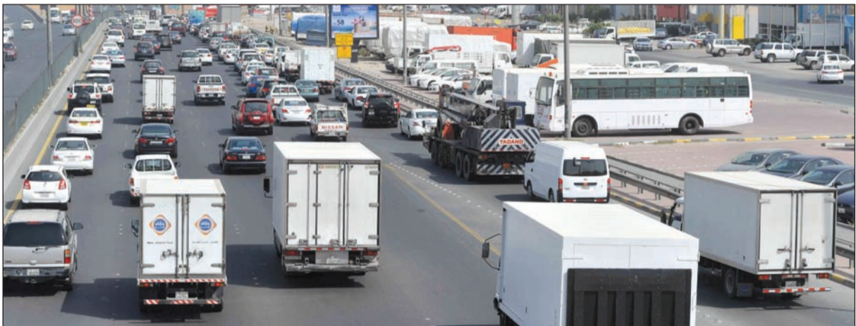
توقف الحركة لساعات على الغزالي