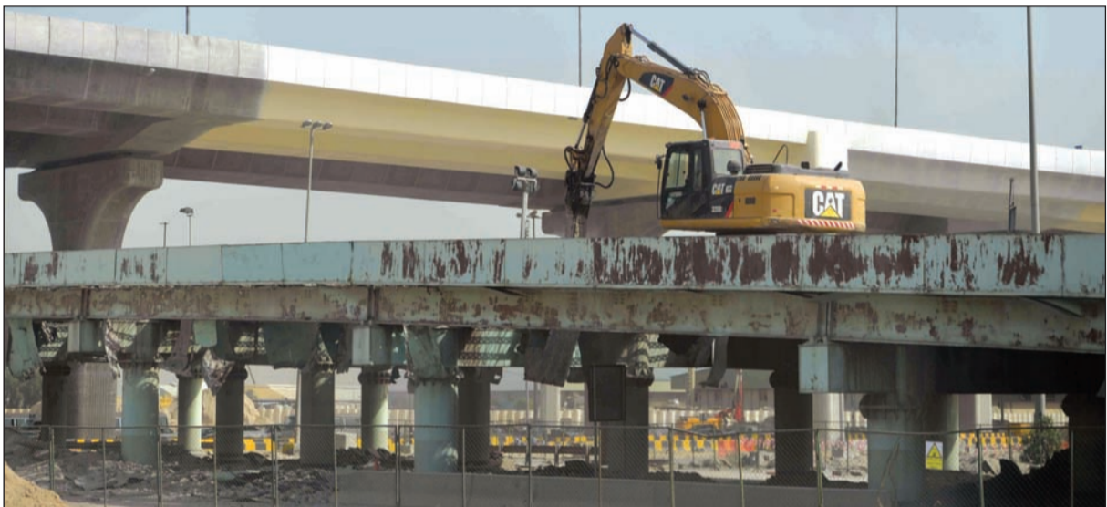
أعمال الهدم على جسر الجامعة