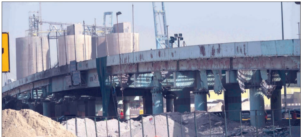
توقف حركة السير على الجامعة