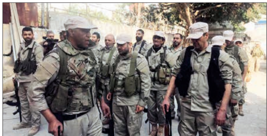
عناصر من القوة المشتركة الفلسطينية في مخيم عين الحلوة في صيدا الذي يبدو خاليا من جراء المارك بدائله