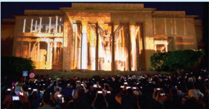
حشد من اللبنانيين في جولة داخل المتحف الوطني المتصد في عرض اليزير خلال افتتاح وزارة الثقافة ليلة المتاحف في بيروت

بيروت: للسنة الرابعة نظمت وزارة الثقافة «ليلة المتاحف» مساء امس الاول مع احتتام شهر الفرنكوفونية في لبنان، حيث فتحت متاحف أبوابها في بيروت وجبيل وصيدا والبلمند مجاناً أمام الزائرين من الخامسة عصرا لغاية الحادية عشر ليلا لتستقبل اللبنانيين ومحبي التراث. وخلال المناسبة جال وزير الثقافة غطاس خوري مع محبي التراث على المتاحف، مؤكدا أهمية لبنان الثقافية والحضارة، وشدد على ضرورة تنمية الحس الثقافي لدى اللبنانيين ونقل صورة لبنان الحضاري إلى الجميع حشد كبير شاركو في أمسية المتاحف. «ليلة المتاحف» لهذا العام تضمنت سلسلة نشاطات فنية وثقافية متنوعة، من عروض موسيقية وأفلام وثائقية ثلاثية الأبعاد، وغيرها من النشاطات المرافقة التي حضرت لها الوزارة لجذب الشباب والعائلات، خصوصا الأولاد، لزيارة المتاحف وفرح وليس لمجرد واجب مدرسي.