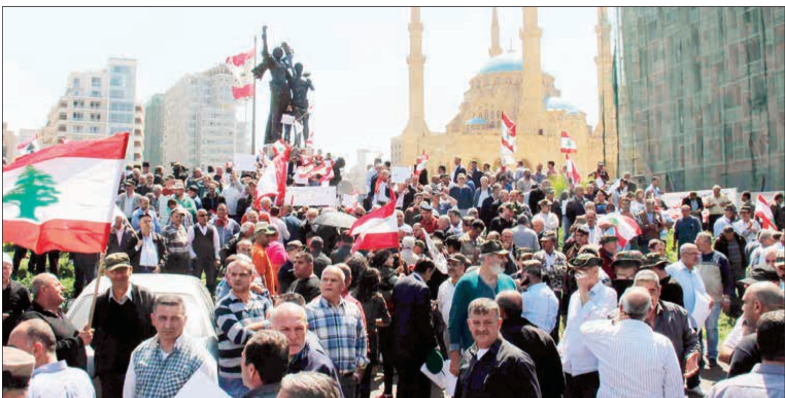
متقاعدو الجيش وقوى الأمن العام وأمن الدولة والجمارك خلال تجمعهم في ساحة الشهداء مطالبين بانصافهم في سلسلة الرتب والرواتب

وقال: هذه الحكومة قد تحصل على ثقة مجلس النواب، لكنها لن تحصل على ثقة ولا على ثقة مجلس النواب، النائب بطرس حرب أثار مجددا قضية الشركة الإيطالية «إيني» التي تقدمت للاستثمار في لبنان بقطاع الغاز، وإذ عرض عليها أحد 300 من وزارة الطاقة رشوة، 300 مليون دولار عمولة توضع بحسابه في سويسرا، مقابل إعطائها مناقصة الغاز على ثلاثة «بلوكات» قبالة الشاطئ