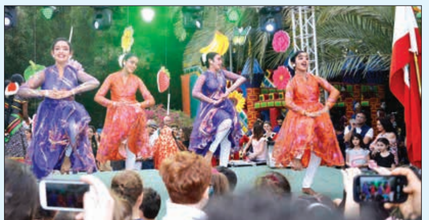
إحدى الفقرات الاستعراضية

أقامت السفارة اللبنانية أول من امس مهرجاناً احتفالاً بأعياد الربيع والذي يجتمع ضمن باقته أعياد الأم والطفل والفصح، في حقيقة السفارة بالدرجة الأولى، بحضور رئيس البعثة اللبنانية ماهر خير، وعدد من أعضاء السلك الدبلوماسي المعتمدين لدى البلاد، وبمشاركة حشد كبير من أبناء الجالية اللبنانية وذلك في ظل أجواء عائلية حملت معها الكثير من البهجة والسرور في قلوب الكبار والصغار. وفي كلمة له أمام الحضور، اعتبر رئيس البعثة ماهر خير أن تجمع الجالية اللبنانية هو «تأكيد على وحدتنا وبمناخ رسالة وطنية باننا ما زلنا متضامنين»، مؤكداً أنها تظل نموذجا حضاريا فريدا يحلم فيه كل لبناني. وفي الوقت الذي أكد فيه خير أن جميع الصعاب التي تمر بها بلاده ستزول في نهاية المطاف، دعا الجالية