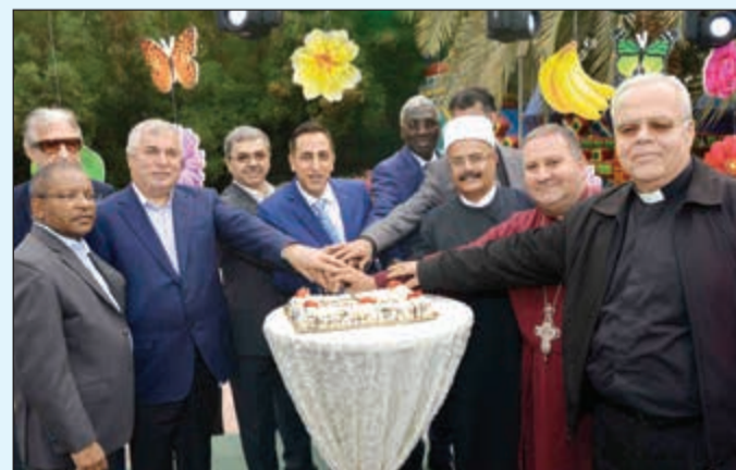
ماهر خير وعدد من السفراء خلال تقطيع كيك الاحتفال

حرم السفارة مع جميع اللبنانيين وانتظروا منا المزيد من التسهيلات والمبادرات البناءة والكثير من المفاجآت» وفي سياق كلمته، وصف خير الجالية اللبنانية «بالنضال المتدفق في عروق الفرح والحياة وفي شرايين كل بقعة على وجه الأرض». وأضاف «لقد أعطيتكم الكثير وما زلتّم تقدمون في كل بلاد الانتشار أجمل العطاءات والانتصارات وتركتم البصمات مشعة تحاكي شموع الشعائين». وختم قائلاً: «بكم يتجدد وجه الأرض ويتجدد لبنان القيامة، فكل عيد أم وطفل وفصح وربيع وأنتم بخير». وتخلل المهرجان العديد من الفقرات المتنوعة بحضور شخصيات كرتونية محببة لدى الأطفال ومسابقات شارك فيها العديد من الأطفال الحاضرين وجرى توزيع الهدايا والألعاب عليهم، ما أضحى أجواء من الفرح والسرور.