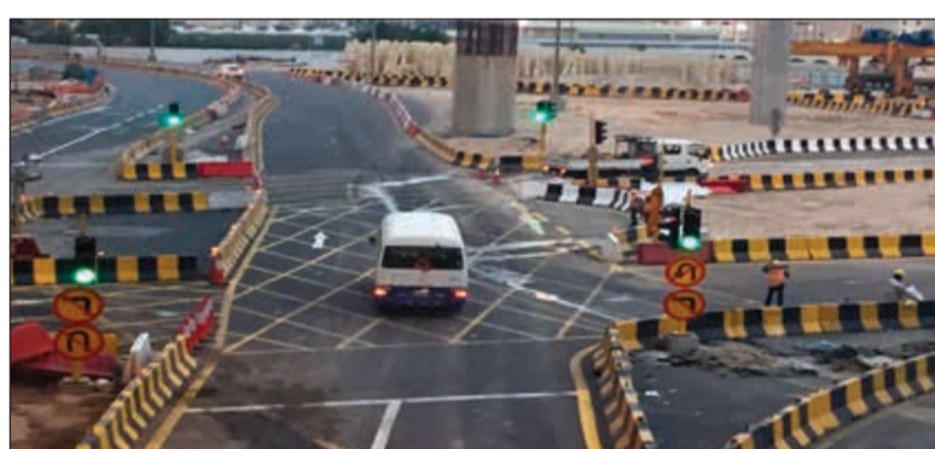
افتتاح إشارة ضوئية وتحويله في شارع جمال عبدالناصر

على ارض الواقع بعد إزالة جسر الغزالي. وقال الغانم ان الطرق المقترحة من قبل وزارة الأشغال لم تسمن ولم تغن من جوع فكيف يعقل ان يتجه طلبة وأساتذة وإداريو 3 كليات وهي العلوم الإدارية والحقوق والعلوم الإدارية بالإضافة إلى موظفي عمادة القبول والتسجيل وموظفي عمادة شؤون الطلبة وموظفي مركز اللغات وموظفي مكتبة الطالب وموظفي إدارة العلاقات العامة والإعلام وموظفي إدارة الخدمات العامة بالإضافة إلى طلبة وموظفي التطبيقي، مؤكدا ان الحلول التي وضعت لحلول ترقيعية لم تكن حلا جزئية أو كافية لعلاج المشكلة.