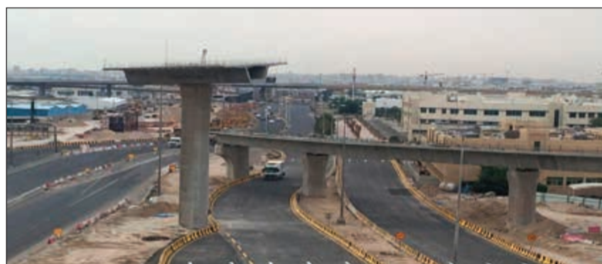
اليوم إزالة جسر الجامعة على الغزالي