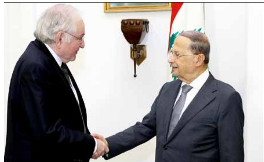
الرئيس العماد ميشال عون مستقبلاً المرشح للرئاسة الفرنسية جاك شيميدان في بعثته (محمود الطويل)