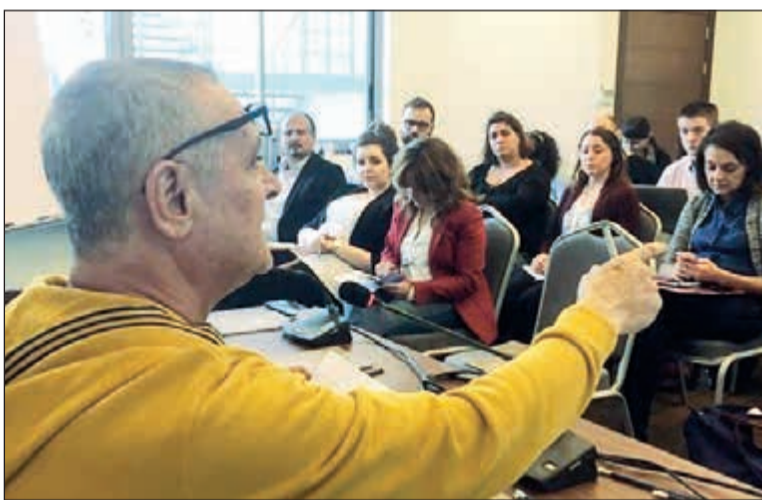
شهادة حية لأحد الصحفيين خلال اللقاء