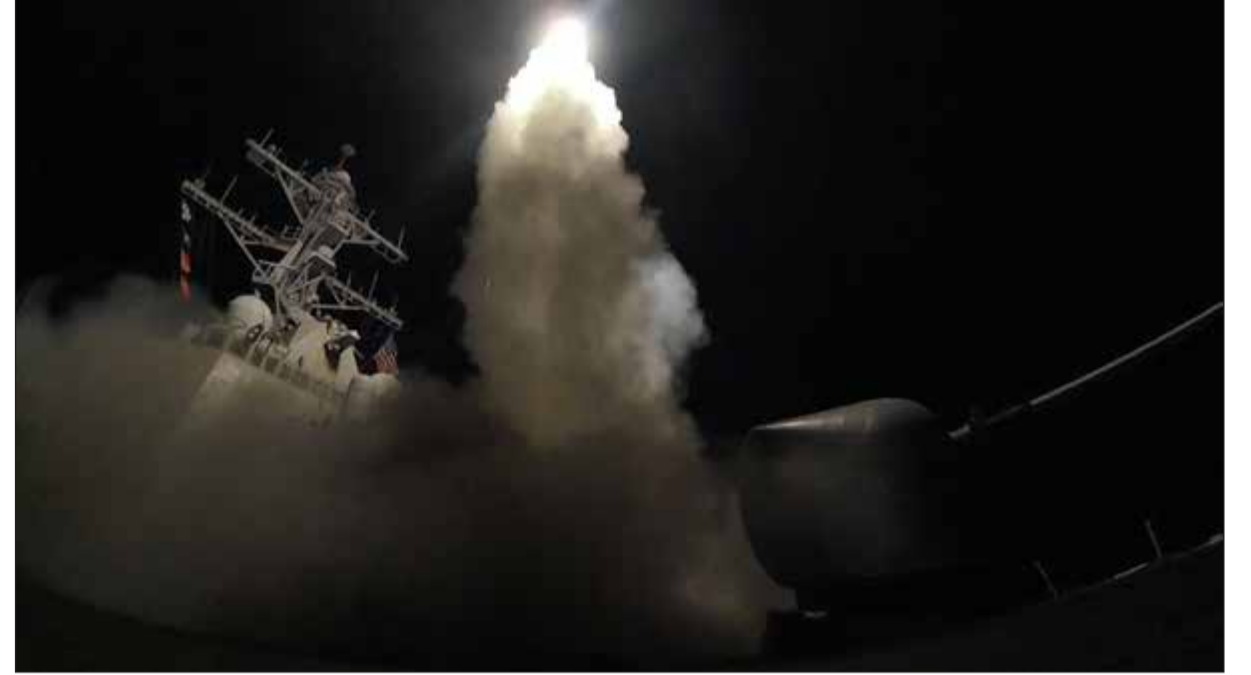
صورة قمتها البحرية الأميركية للمدمرة أوس بورتز (دع78) تطلق صاروخا على مطار الشعيرات السورية (أ.ب)

«فوكس نيوز»، أنها حركت فرقاطة حربية المتوسط نفسه المكان الذي تموضع فيه السفينتان الأمريكيتان اللتان قامتا بضرب مطار الشعيرات. كما أن روسيا أعلنت تعليق الاتفاق مع واشنطن الرامي إلى منع وقوع حوادث جوية بين طائرات البلدين في الأجواء السورية بعد الضربة الصاروخية الأميركية.