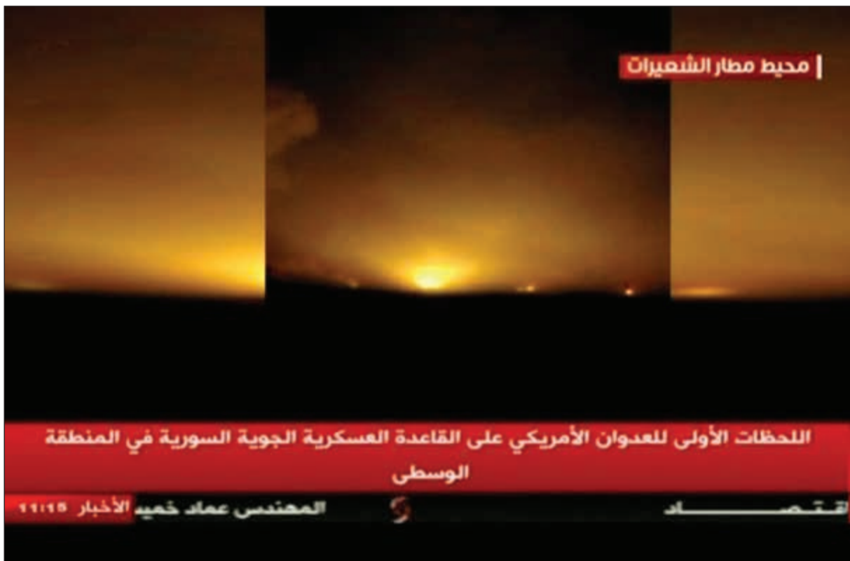
صورة تلفزيونية لمحيط مطار الشعيرات عقب القصف